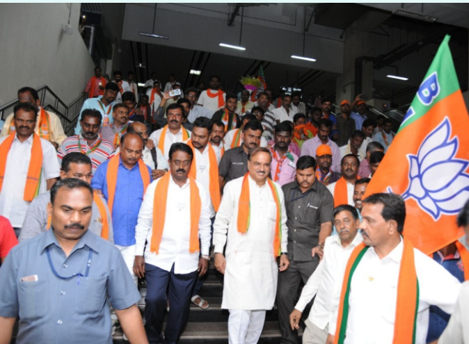
೨೦೧೮ರ ಚುನಾವಣೆಗಳ ಅಂಗವಾಗಿ ಬೆಂಗಳೂರು ಗ್ರಾಮೀಣ ಜಿಲ್ಲೆಯಲ್ಲಿ ನಡೆದ ಪ್ರಚಾರ ಆಂದೋಲನದಲ್ಲಿ ಕಾರ್ಯಕರ್ತರೊಡನೆ