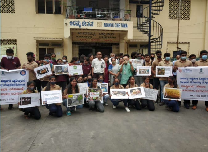
ಎಂ.ಎಸ್. ರಾಮಯ್ಯ ವಿಶ್ವವಿದ್ಯಾಲಯದ ಎನ್ ಎಸ್ ಎಸ್ ವಿದ್ಯಾರ್ಥಿಗಳು ತಮ್ಮ ಕುಲಪತಿ ಮತ್ತು ರಿಜಿಸ್ಟ್ರಾರ್ ರವರೊಡನೆ ಅದಮ್ಯ ಚೇತನಕ್ಕೆ ಭೇಟಿಯಿತ್ತ ಸಂದರ್ಭ. ವಿದ್ಯಾರ್ಥಿಗಳು ಪರಿಸರ ಜಾಗೃತಿ ಮೂಡಿಸುವ ಫಲಕಗಳನ್ನು ಹಿಡಿದು ರ್ಯಾಲಿಯಲ್ಲಿ ಭಾಗವಹಿಸಿದರು.