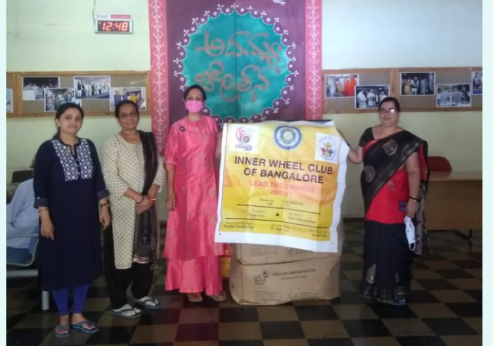
ಸುವಿಧಾ ಸ್ಯಾನಿಟರಿ ನ್ಯಾಪ್ ಕಿನ್ ಗಳನ್ನು ೨೦೧೮ರ ಮಾರ್ಚ್ ತಿಂಗಳಲ್ಲಿ ಮಾರುಕಟ್ಟೆಯಲ್ಲಿ ಲಭ್ಯವಾಗುವಂತೆ ಮಾಡಿದ ನೆನಪಿನಲ್ಲಿ, ಅದಮ್ಯ ಚೇತನದಿಂದ ಬೆಂಗಳೂರು ಇನ್ನರ್ ವೀಲ್ ಮೂಲಕ ೨೦೦೦ ಸುವಿಧಾ ಸ್ಯಾನಿಟರಿ ನ್ಯಾಪ್ ಕಿನ್ ಗಳನ್ನು ನೀಡಲಾಯಿತು.