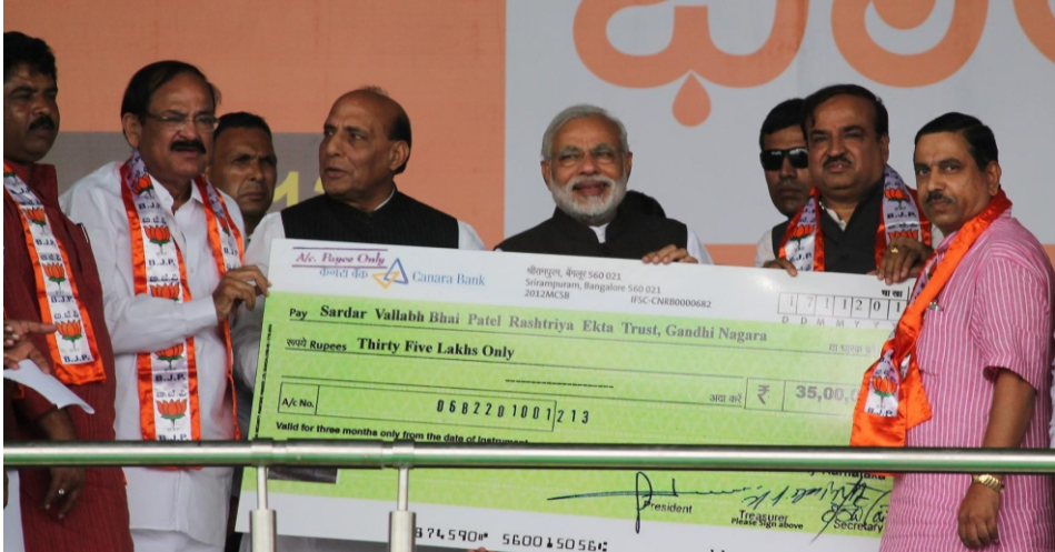
ಶ್ರೀ ಪ್ರಹ್ಲಾದ ಜೋಷಿ ಸಂಸದೀಯ ವ್ಯವಹಾರಗಳ ಸಚಿವರು, ಭಾರತ ಸರ್ಕಾರ

ಅನಂತಕುಮಾರ್ ಅವರು ತಮ್ಮ ಜೀವನದುದ್ದಕ್ಕೂ ಸಹೃದಯತೆ, ಉದಾರತೆಯನ್ನು ಮೆರೆದ ಓರ್ವ ನಿಷ್ಕಳಂಕ, ಪ್ರಾಮಾಣಿಕ ರಾಜಕಾರಣಿ. ಇವತ್ತಿನ ರಾಜಕಾರಣದಲ್ಲಿ