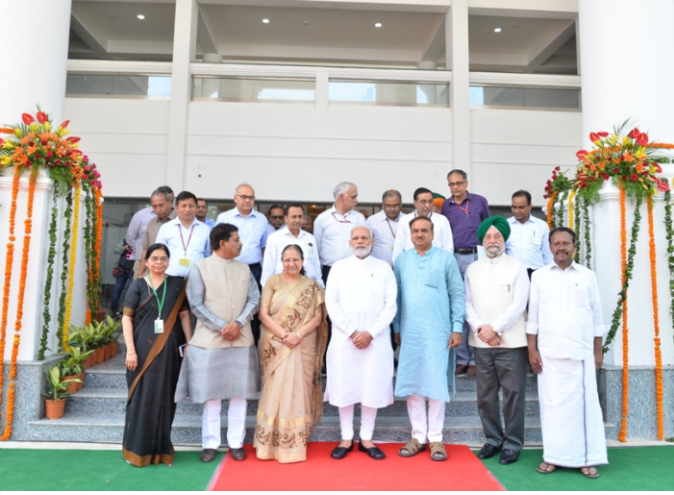
ಸಂಸತ್ ಭವನದ ಅನೇಕ್ ಕಟ್ಟಡದ ಉದ್ಘಾಟನೆಯ ಸಂದರ್ಭದಲ್ಲಿ ಪ್ರಧಾನಿ ಶ್ರೀ ನರೇಂದ್ರ ಮೋದಿ ಮತ್ತು ಹಿರಿಯ ಮುಖಂಡರೊಡನೆ