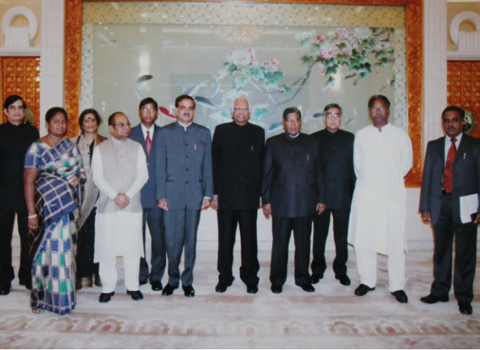
ಚೀನಾ ದೇಶಕ್ಕೆ ಭೇಟಿ ನೀಡಿದ್ದ ಪಾರ್ಲಿಮೆಂಟರಿ ನಿಯೋಗದ ಸದಸ್ಯರಾಗಿ ಶ್ರೀ ಅನಂತಕುಮಾರ್ ಭಾಗವಹಿಸಿದ್ದರು.