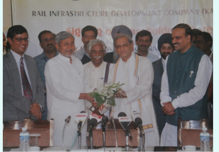
ರೇಲ್ವೆ ಸೌಲಭ್ಯವನ್ನು ಉತ್ತಮಪಡಿಸುವ ಯೋಜನೆಯ ಅಂಗವಾಗಿ ನಡೆದ ಕಾರ್ಯಕ್ರಮದಲ್ಲಿ ಆಗಿನ ಮುಖ್ಯಮಂತ್ರಿ ಎಸ್.ಎಂ. ಕೃಷ್ಣ, ಕೇಂದ್ರ ರೇಲ್ವೆ ಮಂತ್ರಿ ನಿತೀಶ್ ಕುಮಾರರೊಡನೆ