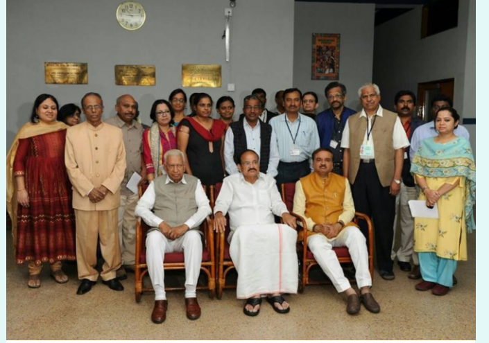
ಸಮಾಜೋ ಆರ್ಥಿಕ ಪರಿವರ್ತನಾ ಸಂಸ್ಥೆ (ISEC) ಗೆ ಭಾರತದ ಉಪರಾಷ್ಟ್ರಪತಿ ಶ್ರೀ ವೆಂಕಯ್ಯ ನಾಯ್ಡುರವರು ಭೇಟಿ ನೀಡಿದ್ದ ಸಂದರ್ಭದ ಚಿತ್ರ