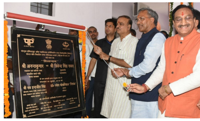
ಶ್ರೀ ತ್ರಿವೇಂದ್ರ ಸಿಂಗ್ ರಾವತ್, ಮಾಜಿ ಮುಖ್ಯಮಂತ್ರಿಗಳು, ಉತ್ತರಾಖಂಡ್

ಒತ್ತಾಯಿಸುತ್ತಿದ್ದೆವು. ಈ ಬಗ್ಗೆ ಮಾನ್ಯ ಅನಂತಕುಮಾರ್ ಅವರನ್ನು ಭೇಟಿಮಾಡಿದಾಗ ಮೊದಲ ಭೇಟಿಯಲ್ಲೇ ಇದಕ್ಕೆ ಸ್ಪಂದಿಸಿದ ಅವರು ಸಂಬಂಧಿತ ಕಾರ್ಯದರ್ಶಿಗಳೆಲ್ಲರನ್ನೂ ಕರೆಸಿ, ಸಮಾಲೋಚಿಸಿದ ನಂತರ ಉತ್ತರಾಖಂಡಕ್ಕೆ ಭೂಮಿಯನ್ನು ವಾಪಸ್ಸು ಮಾಡುವಂತೆ ನಿರ್ದೇಶಿಸಿದರು. ಆಗ ಕಾರ್ಯದರ್ಶಿಗಳು, ಹರಿಯಾಣ ಸರ್ಕಾರವೂ ಸಹ ಭೂಮಿಯನ್ನು ವಾಪಸ್ಸು ಪಡೆದಿದ್ದು, ಕೇಂದ್ರ ಸರ್ಕಾರಕ್ಕೆ ಇದರ ಹಣವನ್ನು ಪಾವತಿಸಿದೆಯೆಂಬ ವಿಷಯವನ್ನು ತಿಳಿಯಪಡಿಸಿದರು. ಐ.ಟಿ.ಪಿ.ಎಲ್ ಬಂದ್ ಆಗಿರುವೆಡೆಗಳಲ್ಲಿ, ರಾಜ್ಯ ಸರ್ಕಾರಕ್ಕೆ ಭೂಮಿಯನ್ನು ವಾಪಸ್ಸುಮಾಡಿದ್ದೇ ಆದಲ್ಲಿ, ಆಯಾ ಸರ್ಕಾರಗಳು ಹಣವನ್ನು ಪಾವತಿಸತಕ್ಕದ್ದೆಂದು ಪಾರ್ಲಿಮೆಂಟಿನಲ್ಲಿ ನಿರ್ಣಯಿಸಲಾಗಿದೆಯೆಂಬ ಮಾಹಿತಿಯನ್ನೂ ಸಹ ಅವರು ಒದಗಿಸಿದರು.