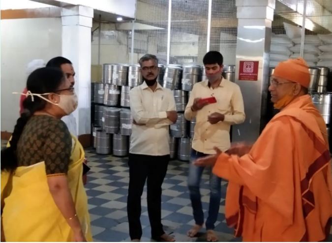
ಪಾವಗಡ ಶ್ರೀ ರಾಮಕೃಷ್ಣ ಮಠದ ಶ್ರೀ ಜಪಾನಂದಜೀಯವರು ಅದಮ್ಯಚೇತನಕ್ಕೆ ಭೇಟಿನೀಡಿದ ಸಂದರ್ಭ