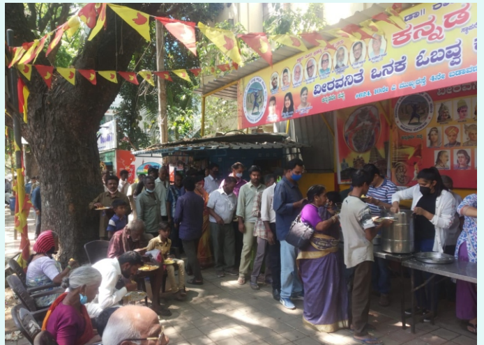
ಬೆಂಗಳೂರಿನ ವಿವಿಧ ಬಡಾವಣೆಗಳಲ್ಲಿ ಜನಪ್ರಿಯವಾಗುತ್ತಿರುವ ನಿತ್ಯ ಅನ್ನದಾನ ಕಾರ್ಯಕ್ರಮ