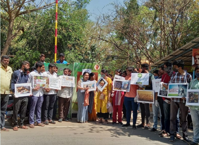
ಸ್ವಚ್ಛತಾ ಕಾರ್ಯಕ್ರಮದ ಜತೆಗೆ ಪರಿಸರಹಾನಿಯ ಬಗೆಗೆ ಜಾಗೃತಿಯುಂಟುಮಾಡುವ ಕಾರ್ಯಕ್ರಮ. ಪ್ಲಾಂಗ್ ಚಟುವಟಿಕೆಯಲ್ಲಿ ಈ ತಿಂಗಳ ವಿಷಯ Food wastage and its Carbon footprint