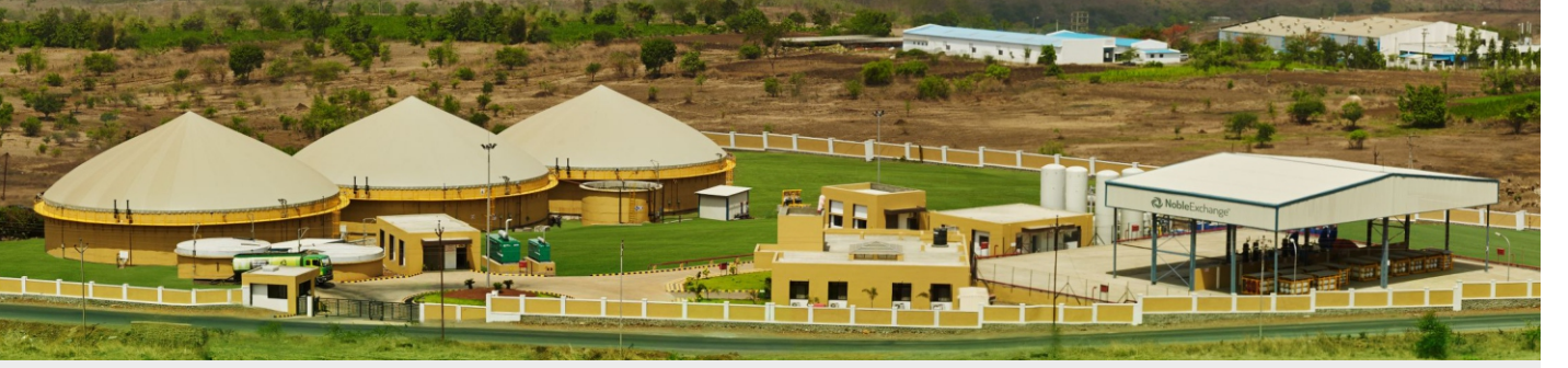
300 TPD food waste to Biogas plant in Pune by Noble Exchangers