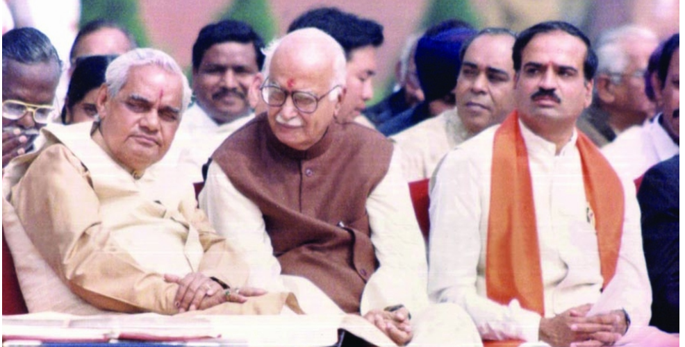
೧೯೯೮ ರಲ್ಲಿ ಅಧಿಕಾರಕ್ಕೆ ಬಂದ ವಾಜಪೇಯಿಯವರ ಮಂತ್ರಿಮಂಡಲದಲ್ಲಿ ಅನಂತ ಕುಮಾರ್ ಮೊದಲ ಬಾರಿಗೆ ಕೇಂದ್ರ ಸಚಿವರಾಗಿ ಸೇವೆ ಸಲ್ಲಿಸುವ ಅವಕಾಶ ಪಡೆದುಕೊಂಡರು.

ಅನಂತಕುಮಾರ್ ಅಟಲ್ ಬಿಹಾರಿ ವಾಜಪೇಯಿಯವರನ್ನು ಮೊದಲಬಾರಿಗೆ ಯಾವಾಗ ಭೇಟಿಯಾಗಿದ್ದರು ಎನ್ನುವುದು ನನಗೆ ಗೊತ್ತಿಲ್ಲ. ೧೯೮೫ರಲ್ಲಿ ಅಖಿಲ ಭಾರತೀಯ ವಿದ್ಯಾರ್ಥಿ ಪರಿಷತ್ತಿನ ರಾಷ್ಟ್ರಮಟ್ಟದ ಅಧಿವೇಶನವೊಂದು ದೆಹಲಿಯಲ್ಲಿ ಏರ್ಪಡಲಾಗಿತ್ತು. ಆ ಸಂದರ್ಭದಲ್ಲಿ ಅನಂತಕುಮಾರ್ ಅವರನ್ನು ಪರಿಷತ್ತಿನ ರಾಷ್ಟ್ರೀಯ ಕಾರ್ಯದರ್ಶಿ ಎಂದು ಘೋಷಣೆ ಮಾಡಲಾಗಿತ್ತು. ಆ ಸಮಾವೇಶದಲ್ಲಿ ಅಟಲ್ ಜೀ ಅವರು ಮುಖ್ಯ ಅತಿಥಿಗಳಾಗಿ ಬಂದಿದ್ದರು. ಶ್ರೀ ದತ್ತಾತ್ರೇಯ ಹೊಸಬಾಳೆ, ಶ್ರೀ ಜಿ.ಪಿ. ನಡ್ಡಾ ಮೊದಲಾದವರ ಭಾಷಣಗಳ ಜೊತೆಗೆ ಅನಂತಕುಮಾರ್ ಅವರ ಭಾಷಣವೂ ಇತ್ತು. ಬಹುಶಃ ಅಲ್ಲೇ ವಾಜಪೇಯಿಯವರೊಡನೆ ಅನಂತಕುಮಾರ್ ಅವರ ಮೊದಲ ಭೇಟಿಯಾಗಿರಬಹುದೇನೋ. ಮುಂದಿನ ದಿನಗಳಲ್ಲಿ ವಿದ್ಯಾರ್ಥಿ ಪರಿಷತ್ತಿನ ಸಮಾವೇಶ ದೆಹಲಿಯಲ್ಲಿ ಇದ್ದಾಗಲೆಲ್ಲ ಬಹುಮಟ್ಟಿಗೆ ಅನಂತಕುಮಾರ್ ಅವರು ಅಟಲ್ ಜೀಯವರನ್ನು ಭೇಟಿಯಾಗುತ್ತ ಇದ್ದರು. ಆ ಸಂದರ್ಭದಲ್ಲಿ ಪಕ್ಷವೂ ಅಷ್ಟು ದೊಡ್ಡದಾಗಿರಲಿಲ್ಲ. ಪಕ್ಷದವರಾಗಿ ಇಬ್ಬರೇ ಎಂ.ಪಿ.ಗಳು ಇದ್ದವರು. ಹೀಗಾಗಿ ವಿದ್ಯಾರ್ಥಿ ಪರಿಷತ್, ಪಕ್ಷ, ಆರ್.ಎಸ್.ಎಸ್. ನ ಎಲ್ಲ ಅಖಿಲ ಭಾರತ ಮಟ್ಟದ ಕಾರ್ಯಕರ್ತರು ಪರಸ್ಪರ ಭೇಟಿಯಾಗುವುದಕ್ಕೂ ವಾಜಪೇಯಿಯವರ ಮನೆಯೇ ತಾಣವಾಗಿರುತ್ತಿತ್ತು.