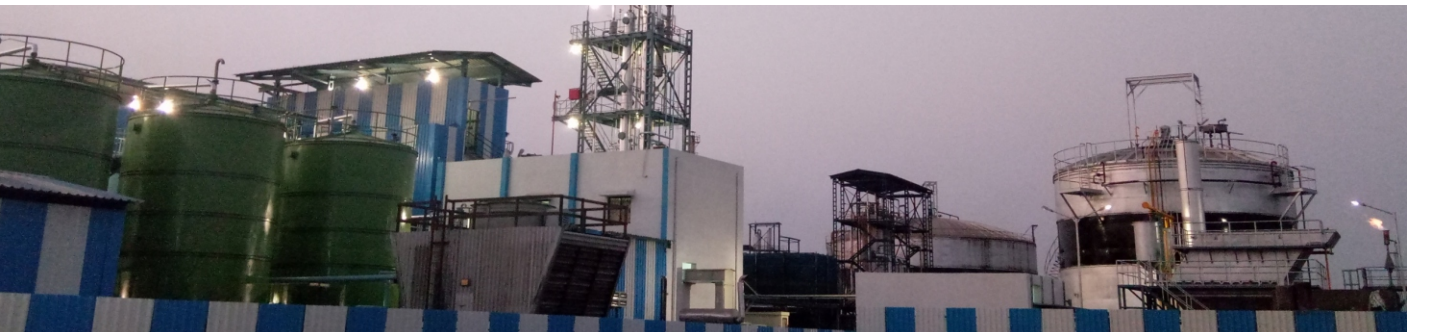
Biomass to Ethanol 12 TPD demo plant by Praj Industries