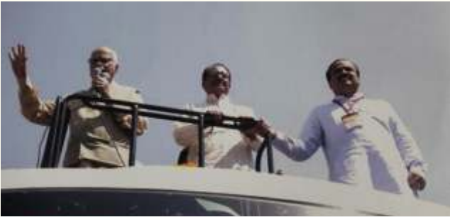
ಜನಚೇತನಾ ಯಾತ್ರೆಯಲ್ಲಿ ಶ್ರೀ ಅಧ್ಯಾನಿ ಮತ್ತು ಶಿವರಾಜ್ ಸಿಂಗ್ ಚೌಹಾಣರೊಡನೆ ಅನಂತಕುಮಾರ್

೨೦೧೧. ಆಗ ಅಧಿಕಾರದಲ್ಲಿದ್ದ ಯುಪಿಎ-೨ ಸರ್ಕಾರದ ವ್ಯಾಪಕ ಭ್ರಷ್ಟಾಚಾರವನ್ನು ವಿರೋಧಿಸಿ ಈ ಜನಚೇತನಾ ಯಾತ್ರೆಯನ್ನು ಸನ್ಮಾನ್ಯ ಶ್ರೀಲಾಲ್‌ಕೃಷ್ಣ ಅಧ್ಯಾನಿ ಅವರ ನೇತೃತ್ವದಲ್ಲಿ ಆಯೋಜಿಸಲಾಗಿತ್ತು. ಆಗ ಭಾಜಪಾ ರಾಷ್ಟ್ರೀಯ ಪ್ರಧಾನ ಕಾರ್ಯದರ್ಶಿಗಳೂ ಪಾರ್ಲಿಮೆಂಟರಿ