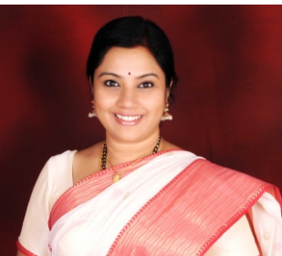
ತಾರಾ ಅನುರಾಧ ಸದಸ್ಯರು, ಕರ್ನಾಟಕ ವಿಧಾನಪರಿಷತ್ತು