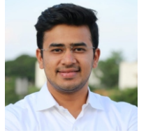
ತೇಜಸ್ವಿ ಸೂರ್ಯ ಲೋಕಸಭಾ ಸದಸ್ಯ

ಅನಂತಕುಮಾರ್ ಎಂದರೆ ಸ್ನೇಹ, ಹಾಸ್ಯ, ಒಬ್ಬರನ್ನು ಗುರುತಿಸಿ ಬೆಳೆಸುವಂತಹದ್ದು. ಇವೆಲ್ಲವೂ ಕೂಡ ನನಗೆ ನೆನಪಾಗುತ್ತದೆ. ಅಂತಹ ದಕ್ಷ ಆಡಳಿತಗಾರ, ನಾಯಕ ಪ್ರೇರಣಾದಾಯಿ ನಮ್ಮಂತಹ ಕೋಟ್ಯಂತರ ಜನರಿಗೆ ಐಡೆಂಟಿಟಿ ಕೊಟ್ಟವರು.. ಅವರು ಸದಾ ನಮ್ಮ ಜೊತೆ ಇರುತ್ತಾರೆ.