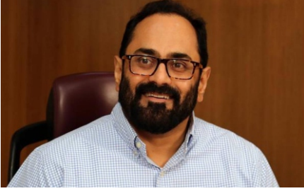
ರಾಜೀವ್ ಚಂದ್ರಶೇಖರ್ ಸಂಸತ್ ಸದಸ್ಯರು, ರಾಜ್ಯಸಭೆ

ನನ್ನೊಡನೆ ಅನಂತಕುಮಾರ್ ಅವರ ಬಾಂಧವ್ಯ ಇಪ್ಪತ್ತೈದು ವರ್ಷಗಳಷ್ಟು ಹಳೆಯದಾದದ್ದು. ಪದೇಪದೇ ಅನಂತಕುಮಾರ್ ಅವರ ಬಗ್ಗೆ ನನ್ನ ಅಭಿಪ್ರಾಯಗಳನ್ನು ಹಂಚಿಕೊಳ್ಳುವುದಕ್ಕೆ,