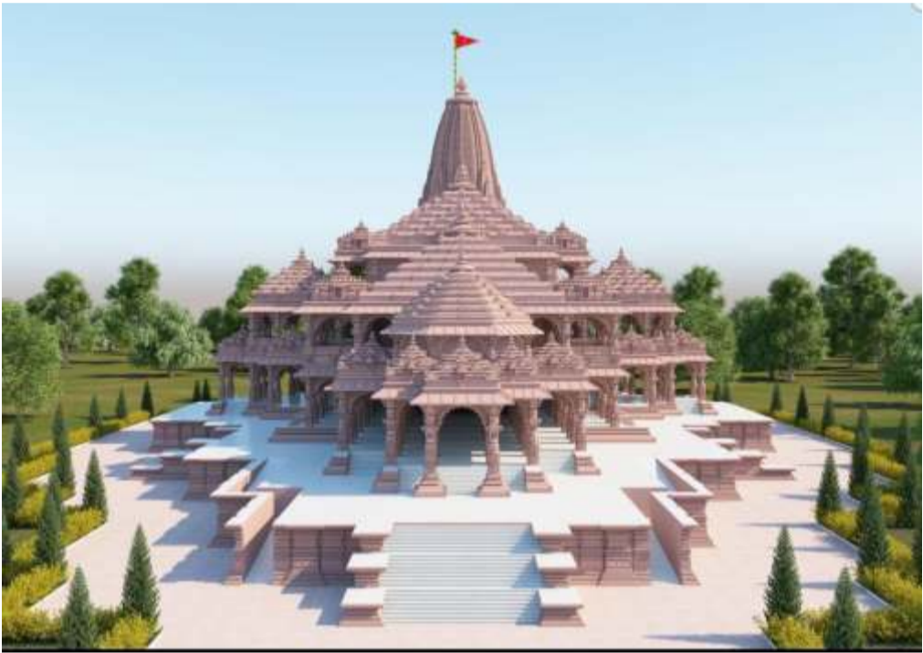
(ಕಾಲ್ಪನಿಕ ಚಿತ್ರ: ಅಂತರ್ಜಾಲದಿಂದ)

ಆದರೆ ಟಿ ವಿ ನ್ಯೂಸ್ ಚಾನೆಲ್ ಗಳು ಇರದೇ ಇದ್ದ ಕಾಲದಲ್ಲಿ ರಾಮನ ಹೋರಾಟವನ್ನು ಮನೆ ಮನೆಗೆ ತಲುಪಿಸಿದ್ದು ವಿಶ್ವ ಹಿಂದೂ ಪರಿಷತ್ತಿನ ಕಾರ್ಯಕರ್ತರು ತರುತ್ತಿದ್ದ ವಿಡಿಯೋ ಕ್ಯಾಸೆಟ್ ಗಳು. ಮನೆ ಹತ್ತಿರ ಯಾರಾದರೂ ಟಿ ವಿ ಇದ್ದವರ ಮನೆಯಲ್ಲಿ