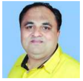
ಪ್ರಶಾಂತ ನಾತು ಪತ್ರಕರ್ತರು ಮತ್ತು ಮಾಧ್ಯಮ ಸಂವಹನಕಾರರು

ಇವತ್ತು ಎಲ್ಲವೂ ಸುಖಾಂತ್ಯವಾಗಿ ರಾಮ ಮಂದಿರಕ್ಕೆ ಅಡಿಗಲ್ಲು ಹಾಕಲಾಗುತ್ತಿದೆ. ತುರ್ತು ಪರಿಸ್ಥಿತಿ ಹೋರಾಟ ನಡೆದಾಗ ನಾವಿನ್ನೂ ಹುಟ್ಟಿರಲಿಲ್ಲ. ಆದರೆ ಅಯೋಧ್ಯೆ ಹೋರಾಟ ನಮ್ಮ ನೆನಪಿನಲ್ಲಿ ಮುಸುಕು ಮುಸುಕಾಗಿ ಯಾವತ್ತೂ ಇರಲಿದೆ. ಆಂದೋಲನಗಳು ಚಳುವಳಿಗಳು ವರ್ತಮಾನದಲ್ಲಿ ಸಾಮಾಜಿಕ ಮತ್ತು ರಾಜಕೀಯ ಅರಿವನ್ನು ಹೆಚ್ಚಿಸುತ್ತವೆ. ಅಷ್ಟೇ ಅಲ್ಲ ಸಮಾಜಕ್ಕೆ ಪ್ರಬುದ್ಧ ನಾಯಕರನ್ನು ಕೂಡ ಕೊಡುತ್ತವೆ ಅನಿಸುತ್ತದೆ. ಆದರೆ ಚಳುವಳಿಯಲ್ಲಿ ಭಾಗವಹಿಸಿದ ಭಾವನಾತ್ಮಕ ನಾಯಕರು ಎಲ್ಲರೂ ಒಳ್ಳೆಯ ಆಡಳಿತಗಾರರೇ ಆಗುತ್ತಾರೆ ಎಂದೇನೂ ಇಲ್ಲ. *