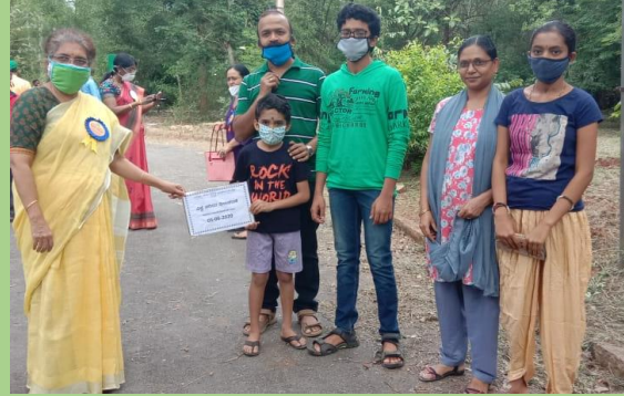
Tree planting program at ISEC - environment day