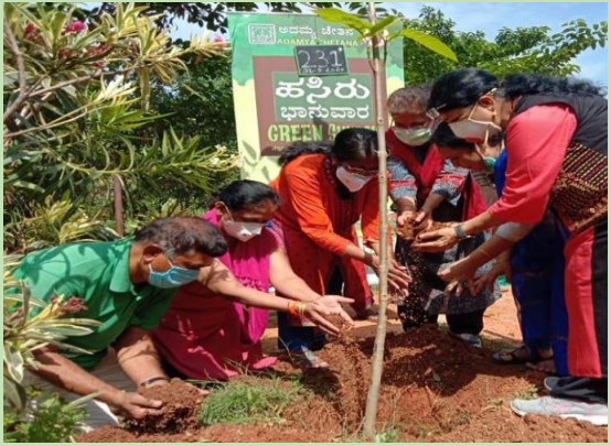
Tree planting with doctors at AnanthaVana