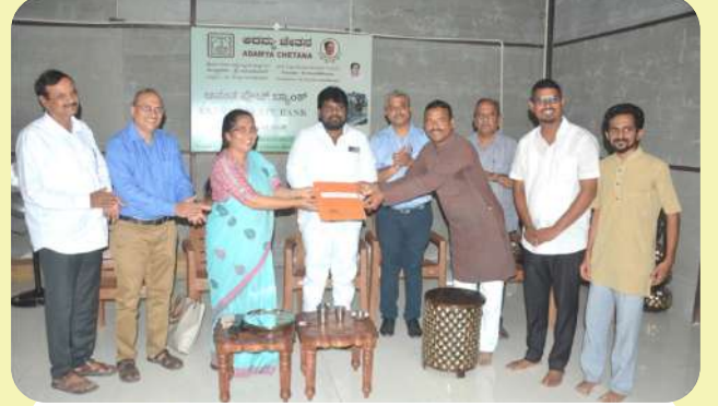
ದಿನಾಂಕ 08/02/2024ರಂದು ಕಲಬುರಗಿಯಲ್ಲಿ ಅನಂತ ಪ್ಲೇಟ್ ಬ್ಯಾಂಕ್ ಪ್ರಾರಂಭವಾಯಿತು. ಈ ಸಂದರ್ಭದಲ್ಲಿ ಸ್ವಾಭಿಮಾನಿ ಸ್ವದೇಶಿ ಮಳಿಗೆಯ ಜೊತೆಗೆ ನಡೆದ ಒಡಂಬಡಿಕೆಯ ವಿನಿಮಯದ ಸಂದರ್ಭದ ಚಿತ್ರ.