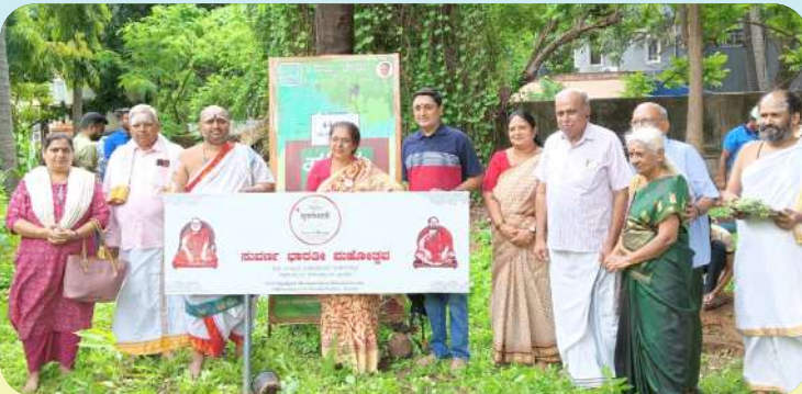
ಶೃಂಗೇರಿ ಶಾರದಾ ಪೀಠದ 21ನೇ ಪೀಠಾಧಿಪತಿಗಳಾದ ಜಗದ್ಗುರು ಶ್ರೀ ಶ್ರೀ ಭಾರತೀತೀರ್ಥ ಮಹಾಸ್ವಾಮಿಗಳವರ ಸನ್ಮಾನ ಸ್ವೀಕಾರದ ಸುವರ್ಣ ಮಹೋತ್ಸವದ ಅಂಗವಾಗಿ 49ನೇ ಹಸಿರು ಭಾನುವಾರ ಕಾರ್ಯಕ್ರಮವು ದಿನಾಂಕ 20/02/2024ರಂದು ಬೆಂಗಳೂರಿನ ಶಂಕರಮಠದ ಆವರಣದಲ್ಲಿ ನಡೆಯಿತು.