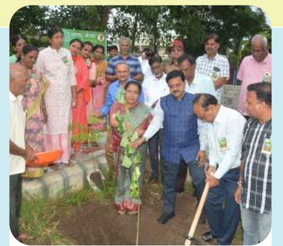
ಕಲಬುರಗಿ ನಗರದ ಭಾಗ್ಯವಂತಿ ನಗರ ಉದ್ಯಾನವನದಲ್ಲಿ ದಿನಾಂಕ 08/02/2024ರಂದು ನಡೆದ ಸಸ್ಯಾಗ್ರಹಣ ಕಾರ್ಯಕ್ರಮದ ಚಿತ್ರ