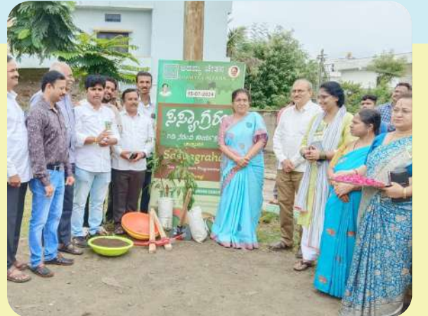
ಕಲಬುರಗಿಯ ಸಾಯಿರಾಂ ಕಾಲೋನಿಯ ಉದ್ಯಾನವನದಲ್ಲಿ ದಿನಾಂಕ 08/02/2024ರಂದು ನಡೆದ ಸಸ್ಯಾಗ್ರಹಣದ ಚಿತ್ರ.