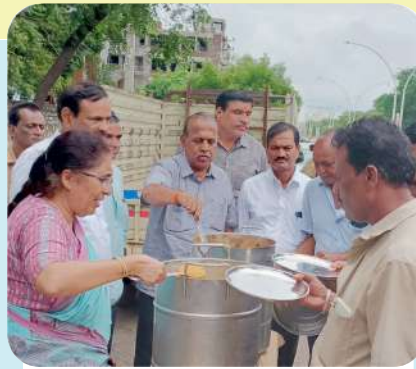
ಕಲಬುರಗಿಯ ಬಸವೇಶ್ವರ ಆಸ್ಪತ್ರೆಯ ಎದುರು ನಿತ್ಯ ಅನ್ನದಾನ ಕಾರ್ಯಕ್ರಮ ಪ್ರಾರಂಭವಾಯಿತು.