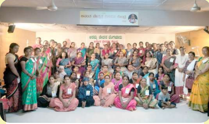
ಹುಬ್ಬಳ್ಳಿಯ ಅನಂತ ಪ್ರೇರಣಾ ಕೇಂದ್ರದಲ್ಲಿ ದಿನಾಂಕ 09/02/2024 ರಂದು ಗ್ರಾಮೀಣ ಮಹಿಳೆಯರ ನಾಯಕತ್ವ ವಿಕಸನಕ್ಕಾಗಿ ಗ್ರಾಮಚೇತನ ಶಿಬಿರವು ನಡೆಯಿತು.

( ಅದಮ್ಯ ಚೇತನ - ತಿಂಗಳ ಚಟುವಟಿಕೆಗಳ ಚಿತ್ರಸಂಪುಟ )