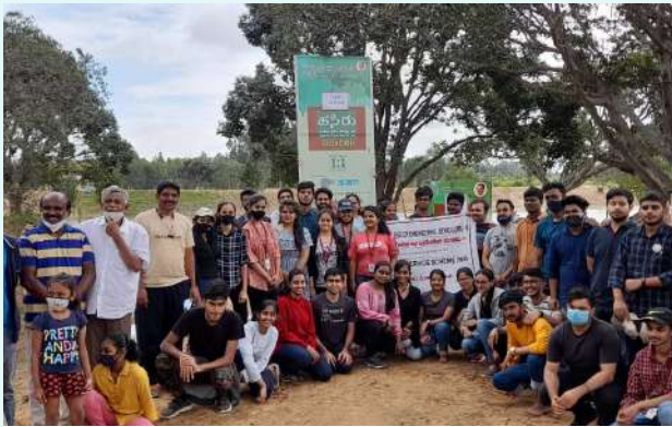
ಪಸಿರು ಭಾನುವಾರ ಕಾರ್ಯಕ್ರಮಗಳಲ್ಲಿ ಉತ್ಸಾಹದಿಂದ ಪಾಲ್ಗೊಳ್ಳುತ್ತಿರುವ ಯುವಜನರ ತಂಡ