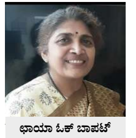
ಛಾಯಾ ಓಕ್ ಬಾಪಟ್

ನಮಗೆ ಪರಿಚಿತವಾದ ಆಲದ ಮರವು ಮೊರೇಸೀ ಕುಟುಂಬಕ್ಕೆ ಸೇರಿದ ಪೈಕಸ್ ಬೆಂಗಾಲೆನ್ಸಿಸ್ ಎಂಬ ಹೆಸರಿನಿಂದ ಗುರುತಿಸಲ್ಪಡುತ್ತದೆ. ಇದೇ ಪೈಕಸ್ (ಆಲ) ಪ್ರಭೇದಕ್ಕೆ ಸೇರಿದ ಕೃಷ್ಣ ಆಲ - ಎಂಬ ಬಗೆಯ ಮರವನ್ನು ಪರಿಚಯ ಮಾಡಿಕೊಳ್ಳೋಣ. ಇದನ್ನು ಪೈಕಸ್ ಕೃಷ್ಣ ಎಂಬ ಭಿನ್ನರೀತಿಯ ಪ್ರಭೇದವೆಂದು ಕರೆಯುವುದೂ ಇದೆ. ಕೊಡೆಯಾಕಾರದ ಹಂದರವುಳ್ಳ ಸುಂದರವಾದ ಮರವಾದ್ದರಿಂದ ಇದನ್ನು ಉದ್ಯಾನವನಗಳಲ್ಲಿ ಅಲಂಕಾರ ಸಸ್ಯವನ್ನಾಗಿ ಬೆಳೆಸುತ್ತಾರೆ.