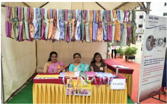
ಪುಟ 2 ರಿಂದ ಮಾಡಿಕೊಳ್ಳಲಾಯಿತು. ಒಂದು ಸೀರೆಯನ್ನು ಸಂಸ್ಥೆಗೆ ತಂದು ಕೊಟ್ಟರೆ ಅದರಿಂದ ಆರು ಚೀಲಗಳನ್ನು ತಯಾರಿಸಿ ಅವುಗಳಲ್ಲಿ ಐದು ಚೀಲಗಳನ್ನು ಉಚಿತವಾಗಿ ವಿತರಣೆ ಮಾಡಿ ಒಂದು ಚೀಲವನ್ನು ಸೀರೆ ಕೊಟ್ಟವರಿಗೆ ಸ್ಮರಣಿಕೆಯ ರೂಪದಲ್ಲಿ ನೀಡುವುದು ಯೋಜನೆ. ಈ ಯೋಜನೆಯಲ್ಲಿ ಯಾವುದೇ

ಲಾಭೋದ್ದೇಶವಿರಲಿಲ್ಲ. ಕೋವಿಡ್ ಆಗಮನಕ್ಕಿಂತ ಆರು ತಿಂಗಳು ಮೊದಲು ಸಂಸ್ಥೆಯು ಕರೆಕೊಟ್ಟಿತ್ತು. ಸಂಸ್ಥೆಯ ಮನವಿಗೆ ಓಗೊಟ್ಟ ನೂರಾರು ಜನರು ಸಾವಿರಾರು ಸೀರೆಗಳನ್ನು ತಂದು ನೀಡಿದರು. ಈ ಸೀರೆಗಳನ್ನು ಪರಿವರ್ತನೆ ಮಾಡಿ ಇದುವರೆಗೆ ಸುಮಾರು 3000 ಸಾವಿರಕ್ಕೂ ಹೆಚ್ಚು ಚೀಲಗಳನ್ನು ಸಂಸ್ಥೆಯು ತಯಾರಿಸಿ ವಿತರಿಸಿದೆ. 2006 ರಲ್ಲಿ ವೈಯಕ್ತಿಕ ನೆಲೆಯಲ್ಲಿ ಪ್ರಾರಂಭವಾದ ಈ ಯೋಜನೆ ಇಂದು ಈ ಮಟ್ಟಕ್ಕೆ ಬಂದು ನಿಂತಿದೆ.