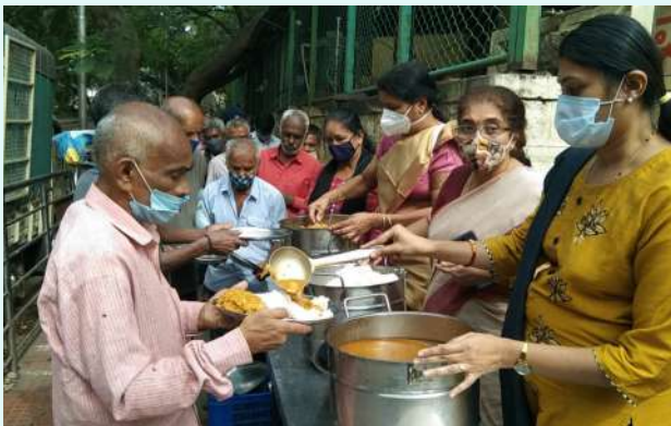
ಅದಮ್ಯ ಚೇತನದ ವತಿಯಿಂದ ನಿತ್ಯ ಅನ್ನದಾನದ ಕಾರ್ಯಕ್ರಮ