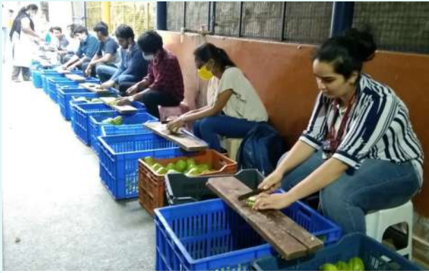
ಬಿ ಎಂ ಎಸ್ ಇಂಜಿನಿಯರಿಂಗ್ ಕಾಲೇಜಿನ ವಿದ್ಯಾರ್ಥಿಗಳು ತಮ್ಮ ಕಾರ್ಯ ಯೋಜನೆಯ ಅಂಗವಾಗಿ ಅದಮ್ಯ ಚೇತನದ ಚಟುವಟಿಕೆಗಳಲ್ಲಿ ಭಾಗವಹಿಸಿ, ಅಡುಗೆಮನೆಯ ಕೆಲಸದಲ್ಲಿ ಕೈಜೋಡಿಸಿದರು.