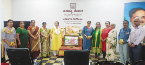
ಅದಮ್ಯ ಚೇತನದಲ್ಲಿ ನಡೆದ ಭಗವದ್ಗೀತೆ ಶ್ಲೋಕ ಪಠನ ಕಾರ್ಯಕ್ರಮ.