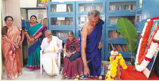
ದಸರಾ ಹಬ್ಬದ ನಿಮಿತ್ತವಾಗಿ ದೇವಿ ಪೂಜೆಯನ್ನು ಅನಂತ ಪ್ರೇರಣಾ ಕೇಂದ್ರದಲ್ಲಿ ಸಡಗರದಿಂದ ಆಚರಿಸಲಾಯಿತು