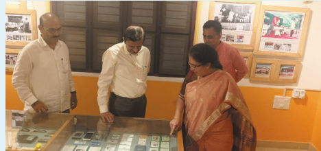
ಅನಂತ ಪ್ರೇರಣಾ ಕೇಂದ್ರಕ್ಕೆ ಜಯದೇವ ಹೃದ್ಯೋಗ ಮತ್ತು ಸಂಶೋಧನ ಸಂಸ್ಥೆಯ ನಿರ್ದೇಶಕರಾದ ಡಾ. ಸಿ.ಎನ್.ಮಂಜುನಾಥ್ ಅವರು ಭೇಟಿ ನೀಡಿದ್ದರು.