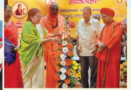
ಮೈಸೂರಿನ ಜೆಎಸ್‌ಎಸ್ ಶಿಕ್ಷಣ ಸಂಸ್ಥೆಯಲ್ಲಿ ನಡೆದ ಅಖಿಲ ಭಾರತ ಶರಣ ಸಾಹಿತ್ಯ ಕದಳಿ ಮಹಿಳಾ ವೇದಿಕೆ ಸಮಾರಂಭವನ್ನು ತೇಜಸ್ವಿನಿ ಅನಂತಕುಮಾರ್ ಅವರು ಉದ್ಘಾಟಿಸಿದರು.