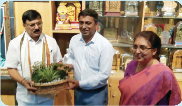
ಗೃಹ ಸಚಿವರಾದ ಶ್ರೀ ಆರಗ ಜ್ಞಾನೇಂದ್ರರವರು ಇತ್ತೀಚೆಗೆ ಅದಮ್ಯ ಚೇತನಕ್ಕೆ ಭೇಟಿ ನೀಡಿದ ಸಂದರ್ಭ.