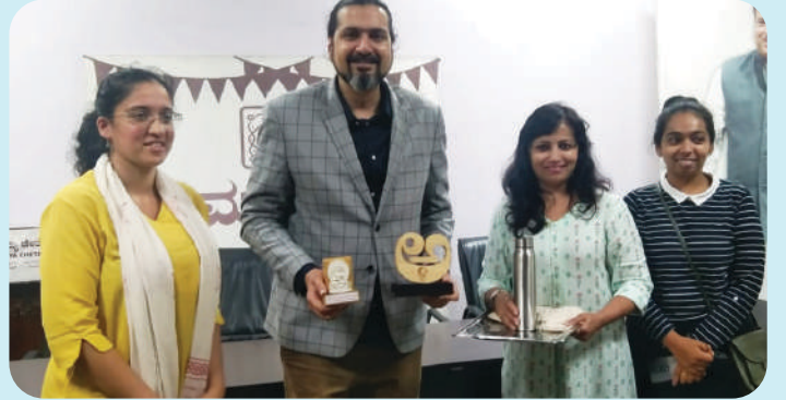
ಅಂತಾರಾಷ್ಟ್ರೀಯ ಖ್ಯಾತಿಯ ಗಾಯಕ ಶ್ರೀ ರಿಕಿ ಕೇಜ್ ರವರು ಅದಮ್ಯ ಚೇತನಕ್ಕೆ ಭೇಟಿ ನೀಡಿದ್ದರು.