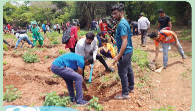
ಹಸಿರು ಭಾವುಕತೆ ಕೆಲವು ಚಿತ್ರಗಳು