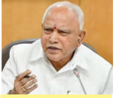
ಬಿ.ಎಸ್. ಯಡಿಯೂರಪ್ಪ ಮಾಜಿ ಮುಖ್ಯಮಂತ್ರಿ, ಕರ್ನಾಟಕ