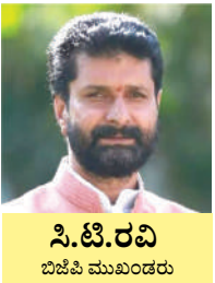
ಸಿ.ಟಿ.ರವಿ ಬಿಜೆಪಿ ಮುಖಂಡರು

ಅನಂತಕುಮಾರರು ನನ್ನ ರಾಜಕೀಯ ಗುರುಗಳು. ಅವರನ್ನು ಜನ್ಮದಿನದ ಪ್ರಯುಕ್ತ 'ಅನಂತ ನಮನ' ಕಾರ್ಯಕ್ರಮದಲ್ಲಿ ಮಾತ್ರವಲ್ಲ, ಮತ್ತೆ ಮತ್ತೆ ನೆನಪಿಸಿಕೊಳ್ಳುತ್ತೇವೆ. ಅನಂತಕುಮಾರರು ದೈಹಿಕವಾಗಿ ನಮ್ಮ ಜೊತೆಗಿಲ್ಲ. ಆದರೆ, ಚೇತನವಾಗಿ ನಮ್ಮ ಜೊತೆಗಿದ್ದಾರೆ. ಬೆಂಗಳೂರಿನ ಅಭಿವೃದ್ಧಿಗೆ ಒಂದು ಭೂಮಿಕೆಯನ್ನು ಹಾಕಿಕೊಟ್ಟಿದ್ದು ಕೆಂಪೇಗೌಡರಾದರೆ, ಅದನ್ನು ವಿಸ್ತರಿಸಿದ್ದು ನಮ್ಮ ಅನಂತಕುಮಾರ್. ಮೆಟ್ರೋ ಮೂಲಕ, ಅಂತಾರಾಷ್ಟ್ರೀಯ ವಿಮಾನ ನಿಲ್ದಾಣದ ಮೂಲಕ ಅದನ್ನು ವಿಸ್ತರಿಸುವ ಕೆಲಸ ಮಾಡಿ ಸದಾ ಬೆಂಗಳೂರಿನ ಜೊತೆಗಿದ್ದಾರೆ. ಕಾವೇರಿಯ ಹೋರಾಟದ ಕಿಚ್ಚು ರಾಜ್ಯದ ಉದ್ದಗಲಕ್ಕೆ ಹಬ್ಬುತ್ತಿರುವ ಸಂದರ್ಭದಲ್ಲಿ ಅನಂತಕುಮಾರರು ಮತ್ತೆ ಮತ್ತೆ ನೆನಪಾಗುತ್ತಾರೆ. ಎಸ್.ಎಂ. ಕೃಷ್ಣ ಅವರು ಮುಖ್ಯಮಂತ್ರಿಯಾಗಿದ್ದಾಗ ಭುಗಿಲೆದ್ದ ಸಮಸ್ಯೆಯನ್ನು ಲೀಲಾಜಾಲವಾಗಿ ಅವರು ಬಗೆಹರಿಸಿದ್ದರು. ಪ್ರತೀ ವರ್ಷ ಅವರಿಗೆ ಹಲವಾರು ಜನ ಕೊಡುತ್ತಿದ್ದ ಡೈರಿಗಳಲ್ಲಿ ಒಂದರ ಮೇಲೆ ನುಡಿಮುತ್ತುಗಳನ್ನು ತಮ್ಮ ಹಸ್ತಾಕ್ಷರದಲ್ಲಿ ಬರೆದು ನನಗೆ ಕೊಡುತ್ತಿದ್ದರು. ಒಂದು ವರ್ಷದ ಡೈರಿಯಲ್ಲಿ 'ಜೀವನ ಒಂದು ಕತ್ತೆ, ಅದನ್ನು ಚೆನ್ನಾಗಿ ದುಡಿಸು' ಎಂಬ ಘೋಷವಾಕ್ಯವನ್ನು ಬರೆದು ಅ.ಕು. ಎಂದು ಸಹಿಮಾಡಿದ್ದರು.