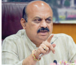
ಬಸವರಾಜ ಬೊಮ್ಮಾಯಿ ಮಾಜಿ ಮುಖ್ಯಮಂತ್ರಿ, ಕರ್ನಾಟಕ

ಅನಂತಕುಮಾರ್- ಅವರ ಹೆಸರೇ ಹೇಳುವಂತೆ ಅನಂತ ಸಾಧನೆಯನ್ನು ಅತ್ಯಂತ ಅಲ್ಪ ಜೀವನಕಾಲದಲ್ಲಿ ಮಾಡಿ ಸಾಧಕರಾದವರು. ನಾನು ಮತ್ತು ಅನಂತಕುಮಾರ್ ಒಂದೇ ತರಗತಿಯಲ್ಲಿ ಓದಿದವರು. ನಾನು ಅವರನ್ನು ಕ್ಲಾಸ್ ಮೇಟ್ ಎಂದು ಕರೆದರೆ ಅವರು "ನಾನು ಕ್ಲಾಸ್‌ಮೇಟ್ ಅಲ್ಲ; ಬೆಂಚ್‌ಮೇಟ್" ಎಂದು ತಿದ್ದುಪಡಿ ಮಾಡುತ್ತಿದ್ದರು. ತಾವು ಬಹಳ ದೂರದೃಷ್ಟಿ ಇರುವ ನಾಯಕ ಎಂಬುದನ್ನು ಅವರು ತಮ್ಮ ವಿದ್ಯಾರ್ಥಿ ಜೀವನದಲ್ಲಿಯೇ ನಿರೂಪಿಸಿದ್ದರು. ಒಂದು ದಿವಸ ಹೀಗೆ ಸಂಜೆ ಚಹಾ ಕುಡಿಯುತ್ತಾ ಕುಳಿತಿದ್ದಾಗ 'ಏ ಬಸವರಾಜ, ಎಲ್ಲ ಕಡೆ ಎಮರ್ಜೆನ್ಸಿ ವಿರುದ್ಧ ಹೋರಾಟ ಆಗ್ತೀ, ಕುಬ್ಜಿಲ್ಲೆಯೊಳಗೆ ಆಗಿಲ್ಲ ನಾವೂ ಹೋರಾಟ ಮಾಡಬೇಕು' ಎಂದರು. ಮುಂದೆ ಒಂದೇ ವಾರದಲ್ಲಿ ಒಂದು ಸಮಿತಿ ಮಾಡಿ, ಅದಕ್ಕೆ ಅವರನ್ನೇ ಸೆಕ್ರೆಟರಿಯನ್ನಾಗಿ ಆಯ್ಕೆ ಮಾಡಿ, ಪ್ರಥಮ ಬಾರಿ ಎಮರ್ಜೆನ್ಸಿಯ ಕಾಲದಲ್ಲಿ ಹೋರಾಟವನ್ನು ಮಾಡಿದೆವು. ಅನಂತಕುಮಾರರು ಅರೆಸ್ಟ್ ಆಗಿ ಜೈಲಿಗೆ ಹೋದರು. ಅವರು ಮನಸ್ಸು ಮಾಡಿದರೆ ಅವತ್ತು ಅರೆಸ್ಟ್ ಆಗಿರಲಿಲ್ಲ. ಆದರೆ ಅವರು ಹೋರಾಟದ ಹುರುಪಿನಲ್ಲಿ ಇದ್ದರು. ಒಂದು ವರ್ಷ ವಿದ್ಯಾಭ್ಯಾಸವೂ ಹಾಳಾಯಿತು. ಆದರೆ ಉತ್ಸಾಹ ಮಾತ್ರ ಏನೂ ಕಡಿಮೆಯಾಗಿರಲಿಲ್ಲ. ಅವರ ವಿಚಾರಗಳ ಪ್ರಖರತೆಯೂ ಕಡಿಮೆಯಾಗಿರಲಿಲ್ಲ.