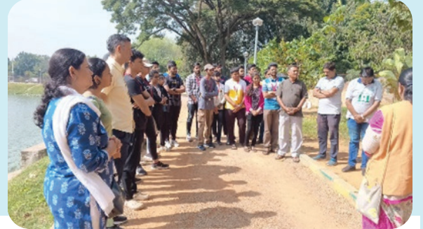
ಬೆಂಗಳೂರಿನ ಅಂಜನಾಪುರ-ಅವಲಹಳ್ಳಿ ಕೆರೆಯ ದಡದಲ್ಲಿ 411ನೇ ಹಸಿರು ಭಾನುವಾರ ಹಾಗೂ ಶ್ರೀ ಅನಂತಕುಮಾರರ ಪುಣ್ಯತಿಥಿ ನಿಮಿತ್ತ 2023ರ ನ. 12ರಂದು ಅದಮ್ಯ ಚೇತನ ಸಂಸ್ಥೆಯಿಂದ ನಾನಾ ಜಾತಿಯ 50 ಗಿಡಗಳನ್ನು ನೆಡಲಾಯಿತು.