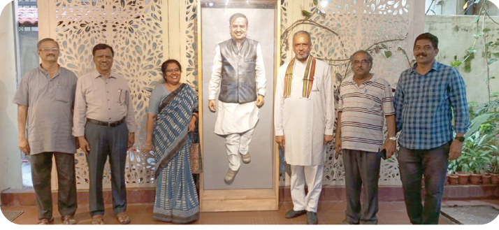
ಕರ್ನಾಟಕದ ವಿಧಾನಸಭೆ ಮಾಜಿ ಸಭಾಧ್ಯಕ್ಷ ವಿಶ್ವೇಶ್ವರ ಹೆಗಡೆ ಹಾಗೇರಿ ಅವರು ಅ. 31ರಂದು ಸೌತ್ ಎಂಡ್ ಸರ್ಕಲ್ ಬಳಿಯ ಅನಂತ ಪ್ರೇರಣಾ ಕೇಂದ್ರಕ್ಕೆ ಭೇಟಿ ನೀಡಿದ್ದರು