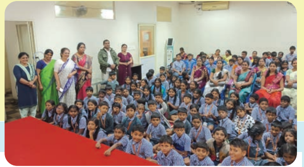
ಬೆಂಗಳೂರಿನ ಹಲಸೂರಿನ ಶ್ರೀ ಯೋಗೇಶ್ವರಾನಂದ ಶಿಕ್ಷಣ ಸಂಸ್ಥೆಯ 150 ವಿದ್ಯಾರ್ಥಿಗಳು ಹಾಗೂ 15 ಶಿಕ್ಷಕರು ಜೊತೆಗೂಡಿ, ಅ. 07ರಂದು, ಗವಿಪುರದ ಅದಮ್ಯ ಚೇತನ ಸಂಸ್ಥೆಯ 'ಅನ್ನಪೂರ್ಣ' ಅಡುಗೆ ಮನೆಗೆ ಭೇಟಿ ನೀಡಿದರು.