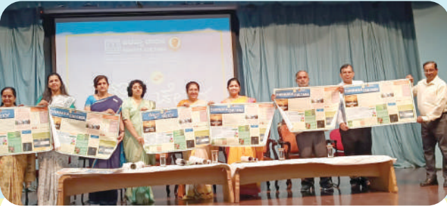
ಬೆಂಗಳೂರಿನ ಎಚ್.ಎಸ್.ಆರ್. ಲೇಔಟ್‌ನಲ್ಲಿರುವ ಆಕ್ಸ್‌ಫರ್ಡ್ ಮಹಾವಿದ್ಯಾಲಯದ ಕಾಲೇಜಿನ ಸಭಾಂಗಣದಲ್ಲಿ ಆಗಸ್ಟ್ ತಿಂಗಳ 'ಚಿಣ್ಣರ ಚೇತನ' ಗೋಡೆಪತ್ರಿಕೆಯನ್ನು 11/08/23 ರಂದು ಬಿಡುಗಡೆ ಗೊಳಿಸಲಾಯಿತು.