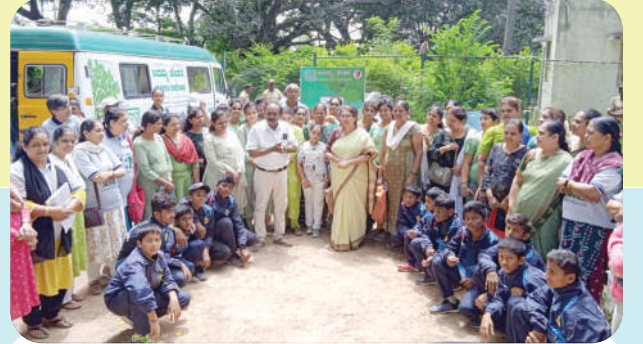
ಅದಮ್ಯ ಚೇತನ ಸಂಸ್ಥೆ, ವಾಸವಿ ಸೇವಾ ಸಮಿತಿ ಹಾಗೂ ಸಮಾನ ಮನಸ್ಸುಗಳೆಯರ ಬಳಗದ ಸಹಯೋಗದೊಂದಿಗೆ ಕೋಲಾರದ ಅಂತರಗಂಗಿಯಲ್ಲಿ 06/08/23 ರಂದು 397 ನೇ ಹಸಿರು ಭಾನುವಾರ ಕಾರ್ಯಕ್ರಮವನ್ನು ಆಯೋಜಿಸಲಾಗಿತ್ತು.