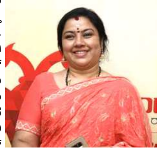
ತಾರಾ ಅನುರಾಧ ಚಲನಚಿತ್ರ ಕಲಾವಿದೆ

ರಾಖಿ ಹೆಚ್ಚು ಬಂದಾಗ ನಾನು ಅಣ್ಣ ಅನಂತಕುಮಾರರಿಗೆ ರಾಖಿ ಕಟ್ಟುತ್ತಿದ್ದೆ. ನನಗೆ ಅವರ ಅನಾರೋಗ್ಯದ ಬಗ್ಗೆ ತಿಳಿದಿರಲಿಲ್ಲ. ಒಮ್ಮೆ ಭೇಟಿಯಾದಾಗ, "ಅಣ್ಣ ನೀವು ತುಂಬಾ ಸೊಂಗೆದ್ದೀರಿ" ಎಂದೆ. ಅವರು "ನೀವು ಸಿನಿಮಾದವರು. ಸ್ಲಿಮ್ ಆಗಿ ಕಾಣಬೇಕು. ನಾನು ನೋಡಿ, ಎಷ್ಟು ಕಷ್ಟಪಡುತ್ತಾ ಇದ್ದೀನಿ" ಎಂದು ವಿನೋದ ಮಾಡಿದ್ದರು. ಅಂತಹ ಅನಾರೋಗ್ಯದಲ್ಲೂ ಅವರ ಹಾಸ್ಯಪ್ರಜ್ಞೆ ಜಾಗೃತವಾಗಿತ್ತು. ಅವರು ಲಂಡನ್‌ಗೆ ಚಿಕಿತ್ಸೆಗಾಗಿ ಹೋಗುವ ಮುಂಚೆ ನನ್ನ ನಟನೆಯ 'ಹೆಚ್ಚಿಟ್ಟು ರಾಮಕ್ಕ' ಮತ್ತು 'ಸಾವಿತ್ರಿ ಬಾಯಿ ಪುಲಿ'-ಈ ಎರಡೂ ಚಿತ್ರಗಳ ಪ್ರತಿಗಳನ್ನು ಕೊಡಲು ಕೇಳಿದ್ದರು. ಕಾರಣಾಂತರದಿಂದ ತಲುಪಿಸಲು ಆಗಲಿಲ್ಲ. ಆ ನೋವು ನನ್ನನ್ನು ಇಂದಿಗೂ ಕಾಡುತ್ತಿದೆ. ಸರಳ ಬದುಕಿನಿಂದ, ಉನ್ನತ ವಿಚಾರಗಳಿಂದ ಅಸಾಮಾನ್ಯರಾದ ಅನಂತಕುಮಾರರು ಸಾಮಾನ್ಯ ಕಾರ್ಯಕರ್ತರನ್ನೂ ಆತ್ಮೀಯವಾಗಿ ಮಾತನಾಡಿಸುತ್ತಿದ್ದರು. ಅನಂತಕುಮಾರರ ಮಾದರಿ ವ್ಯಕ್ತಿತ್ವವನ್ನು ಬಿಂಬಿಸುವ ಲೇಖನಗಳು 'ಅನಂತಪಥ' ಮಾಸಪತ್ರಿಕೆಯಲ್ಲಿ ಪ್ರಕಟವಾಗುತ್ತಿವೆ. ಅನಂತಕುಮಾರರ ಸಾಧನೆಗಳ ಜೊತೆಗೆ ಇತರ ವಿಷಯಗಳನ್ನು ಕುರಿತ ಬರಹಗಳೂ ಪತ್ರಿಕೆಯ ಮೌಲ್ಯವನ್ನು ಹೆಚ್ಚಿಸಿವೆ. ಸಂಸ್ಕೃತಿ ಬೆಳೆಸುವ ಇಂತಹ ಪತ್ರಿಕೆಗಳನ್ನು ಯುವಕರು ಓದುವ ಹವ್ಯಾಸ ಬೆಳೆಸಿಕೊಳ್ಳಬೇಕು. ಈ 'ಅನಂತಪಥ' ಹೀಗೆಯೇ ಯಶಸ್ವಿಯಾಗಿ ಪ್ರಕಟವಾಗುತ್ತಿರಲಿ.