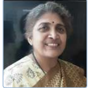
ಛಾಯಾ ಓಕ್ ಬಾಪಟ್

ಕೊಳವೆಯಾಕಾರದ ಹೂವುಗಳ ಗೊಂಚಲುಗಳು ಅರಳುತ್ತವೆ. ರಾತ್ರಿಯಲ್ಲಿ ಅರಳುವ ಹೂವುಗಳು ಬೆಳಗಾಗುವ ಹೊತ್ತಿಗೆ ಉದುರಿ ಮರದ ಬುಡದಲ್ಲಿ ತೆಳುಹಾಸಿನಂತೆ ಚದುರಿ ಉದುರುತ್ತವೆ. ಬೆಳದ ಮರದ ಸುತ್ತಲೂ ಸಸಿಗಳು ತಾವಾಗಿಯೇ ಹುಟ್ಟಿಕೊಳ್ಳುತ್ತವೆ. ಈ ಸಸಿಗಳನ್ನು ತೆಗೆದು ಬೇರೆ ಕಡೆ ನೆಟ್ಟು ಬೆಳೆಸಬಹುದು. ಉದ್ದನೆಯ ರೆಕ್ಕೆಗಳಿರುವ ಬೀಜಗಳಿದ್ದರೂ ಟೊಂಗೆಗಳನ್ನು ಕತ್ತರಿಸಿ ನೆಡುವುದು ಒಳ್ಳೆಯದು. ಉಪಯೋಗಗಳು: ತೊಗಟೆಯಿಂದ (ಕಡಿಮೆ ದರ್ಜೆಯ) ಬಿರಟಿ (Cork) ತಯಾರಿಸುತ್ತಾರೆ. ಹಳದಿ ಛಾಯೆಯ ಬಿಳಿ ಬಣ್ಣದ ಮೃದುವಾದ ಕಾಂಡವನ್ನು ಟೀ ಪೆಟ್ಟಿಗೆ, ಪೀಲೋಪಕರಣಗಳು ಮತ್ತು ಅಲಂಕಾರ ವಸ್ತುಗಳು, ಕಾಗದ ಹಾಗೂ ರಿಯಾನ್ ತಯಾರಿಕೆಗೆ ಬಳಸುತ್ತಾರೆ. ತೊಗಟೆಯು ಜ್ವರ ನಿವಾರಕ ಎನ್ನಲಾಗುತ್ತಿದೆ. ಸಿಗರೇಟಿನ ತಯಾರಿಕೆಯಲ್ಲಿ ತಂಬಾಕಿಗೆ ಬದಲಿಯಾಗಿ ಈ ಮರದ ಎಲೆಗಳನ್ನು ಬಳಸುತ್ತಾರೆ. ಇದರ ಸುವಾಸನೆಯು ಹೂವುಗಳನ್ನು ಅಲಂಕಾರಕ್ಕೂ ಬಳಸುತ್ತಾರೆ.