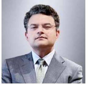
ಡಾ. ಆನಂದ್ ರಂಗನಾಥನ್ ಪ್ರಾಧ್ಯಾಪಕರು, ಜವಾಹರಲಾಲ್ ನೆಹರೂ ವಿಶ್ವವಿದ್ಯಾಲಯ, ನವದೆಹಲಿ

ಸಂವಿಧಾನ ಸಭೆಯ ಆಶಯಗಳು: ಈ ಕಾನೂನನ್ನು ವಿರೋಧಿಸುವ ಅನೇಕರು ಸಂವಿಧಾನವೊಂದೇ ನಾವು ಗೌರವಿಸುವ ಗ್ರಂಥ, ಇತರ ಧಾರ್ಮಿಕ ಗ್ರಂಥಗಳು ನಮಗೆ ಮಾನ್ಯವಲ್ಲ ಎಂದು ಹೇಳುತ್ತಾರೆ. ಡಾ. ಅಂಬೇಡ್ಕರ್ ಈ ಕಾನೂನಿನ ಪರವಾಗಿದ್ದರು. ಸಂವಿಧಾನದ ನಿರ್ದೇಶಕ ತತ್ವಗಳಲ್ಲಿ (ಕಲಂ ೪೪) ಸೇರಿಕೊಂಡಿರುವ ಸಮಾನ ನಾಗರಿಕ ಸಂಹಿತೆಯ ಪ್ರಸ್ತಾವಕ್ಕೆ ಕೆಲವು ಮುಸ್ಲಿಂ ಶಾಸಕರು ಸೂಚಿಸಿದ "ಈ ಕಾನೂನು ವೈಯಕ್ತಿಕ ಕಾನೂನುಗಳನ್ನು ಹೊಂದಿರುವ ಧರ್ಮಗಳನ್ನು ಹೊರತುಪಡಿಸಿ ಇತರ ಎಲ್ಲಾ ನಾಗರಿಕರಿಗೆ ಅನ್ವಯವಾಗುತ್ತದೆ" ಎಂಬ ತಿದ್ದುಪಡಿಯನ್ನು ಅಂಬೇಡ್ಕರ್ ತಿರಸ್ಕರಿಸಿದ್ದರು. ಸಂವಿಧಾನ ಸಭೆಯಲ್ಲಿ ಈ ಕುರಿತಾದ ಚರ್ಚೆಯ ಸಂದರ್ಭದಲ್ಲಿ "ಧರ್ಮಗಳಿಗೆ ತಮ್ಮ ಅನುಯಾಯಿಗಳ ಸಮಗ್ರ ಜೀವನವನ್ನು ನಿಯಂತ್ರಿಸುವ ಅಧಿಕಾರವ್ಯಾಪ್ತಿಯಿರಬೇಕು ಎಂಬ ವಾದಸರಣಿಯನ್ನು ಒಪ್ಪುವುದು ಸಾಧ್ಯವಿಲ್ಲ. ಈ ವಿಷಯಗಳಲ್ಲಿ ಶಾಸಕಾಂಗದ ಅಧಿಕಾರವನ್ನು ಏಕೆ ಮೊಟಕುಗೊಳಿಸಬೇಕು? ನಮ್ಮ ಸಾಮಾಜಿಕ ವ್ಯವಸ್ಥೆಯಲ್ಲಿ ಮೂಲಭೂತ ಹಕ್ಕುಗಳಿಗೆ ವಿರುದ್ಧವಾದ ತಾರತಮ್ಯ, ಅಸಮಾನತೆಗಳನ್ನು ತೊಡೆದು ಹಾಕುವುದಕ್ಕಾಗಿ ನಮಗೆ ಸ್ವಾತಂತ್ರ್ಯ ದೊರೆತಿರುವುದು" ಎಂದು ಅವರು ಹೇಳಿದ್ದರು.