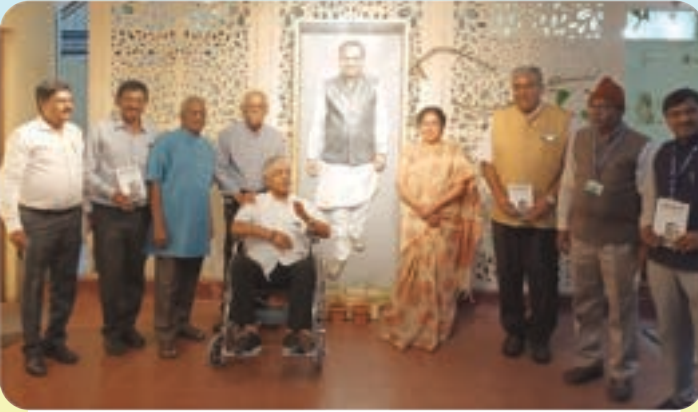
ದೇಶದ ವೈಮಾನಿಕ ಕ್ಷೇತ್ರದ ಹೆಸರಾಂತ ವಿಜ್ಞಾನಿಗಳು ಅನಂತ ಪ್ರೇರಣಾ ಕೇಂದ್ರಕ್ಕೆ ಭೇಟಿ ನೀಡಿದ ಸಂದರ್ಭದ ಚಿತ್ರ