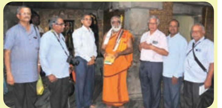
ದೇಗುಲ ದರ್ಶನ ಕಾರ್ಯಕ್ರಮದ ಅಂಗವಾಗಿ ಅದಮ್ಯ ಚೇತನದ ವತಿಯಿಂದ ಚನ್ನರಾಯಪಟ್ಟಣ ಮತ್ತಿತರ ಸ್ಥಳಗಳ ಪುರಾತನ ದೇಗುಲಗಳಿಗೆ ಭೇಟಿ ನೀಡಿ ಅಲ್ಲಿನ ಅರ್ಚಕರನ್ನು ಗೌರವಿಸಲಾಯಿತು.

ಬೆಂಗಳೂರಿನ ವಿವಿಧೆಡೆ ನಡೆಯುವ ಕಾರ್ಯಕ್ರಮಗಳಲ್ಲಿ ಅದಮ್ಯ ಚೇತನದ ತಟ್ಟೆ ಮತ್ತು ಲೋಟಗಳು ಬಳಕೆಯಾಗುತ್ತಿವೆ. ಮೇ ತಿಂಗಳಲ್ಲಿ 27 ಖಾಸಗೀ ಕಾರ್ಯಕ್ರಮಗಳಿಗೆ 5,230 ತಟ್ಟೆ, 8,990 ನೀರಿನ ಲೋಟ, 3,645 ಕಾಫಿ ಲೋಟ, 4,277 ಬಟ್ಟಲು, 3,680 ಚಮಚಗಳನ್ನು ಸಾರ್ವಜನಿಕರು ಪಡೆದಿದ್ದರು.