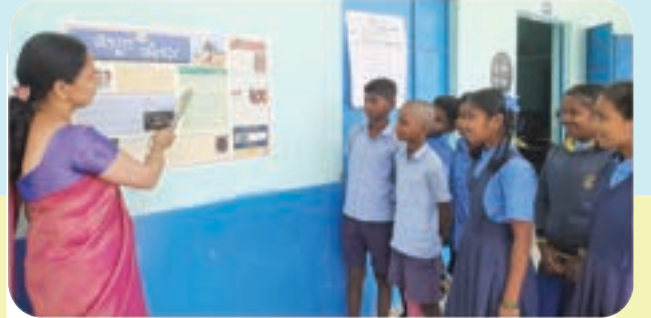
ಅದಮ್ಯ ಚೇತನದ ಚಿಣ್ಣರ ಚೇತನ ಗೋಡೆ ಪತ್ರಿಕೆಯ ಹೊಸ ಸರಣಿ ಯ ಸಂಚಿಕೆಯನ್ನು ಇತ್ತೀಚೆಗೆ ಬಿಡುಗಡೆ ಮಾಡಲಾಯಿತು.