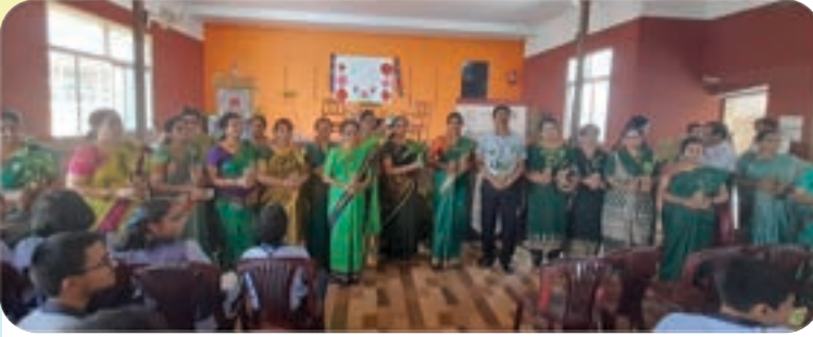
ವಿದ್ಯಾವರ್ಧಕ ಸಂಘದ ಶಾಲೆಯಲ್ಲಿ ವಿಶ್ವ ಪರಿಸರ ದಿನಾಚರಣೆಯ ಅಂಗವಾಗಿ 100 ಔಷಧೀಯ ಸಸ್ಯಗಳನ್ನು ಮಕ್ಕಳಿಗೆ ವಿತರಿಸಲಾಯಿತು.