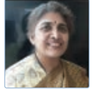
● ಛಾಯಾ ಓಕ್ ಬಾಪಟ್

ಇತರ ಉಪಯೋಗಗಳು: ಜಾಸ್ತಿ ನೀರನ್ನೂ ಹೆಚ್ಚಿನ ಉಪಚಾರವನ್ನೂ ಅಪೇಕ್ಷಿಸದ ಈ ಸಸ್ಯವು ತಾನೇ ತಾನಾಗಿ ತೋಟದಲ್ಲಿ, ಬೇಲಿಗಳ ಮೇಲೆ ಪಸರಿಸುತ್ತದೆ. ಸಹಜವಾಗಿ ಬೆಳೆಯುವ ಈ ಗಿಡವನ್ನು ಅಲಂಕಾರಕ್ಕಾಗಿ ಬೆಳೆಸಬಹುದು. ಈ ಗಿಡದ ಎಲೆಯ ಕೊಂಬೆಗಳನ್ನು ಹಾಗೂ ಎಲೆಗಳನ್ನು ಹಸಿರೇಲಿ ಗೊಬ್ಬರಕ್ಕಾಗಿ ರೈತರು ಬಳಸುತ್ತಾರೆ.