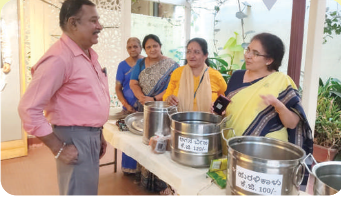
ಮಾ. 11 ರಂದು ಅನಂತ ಪ್ರೇರಣಾ ಕೇಂದ್ರದಲ್ಲಿ ನಡೆದ ಪೌಷ್ಟಿಕ ಸಾತ್ವಿಕ ಆಂದೋಲನ ಕಾರ್ಯಕ್ರಮದಲ್ಲಿ ಅನೇಕರು ಭಾಗವಹಿಸಿದ್ದರು.