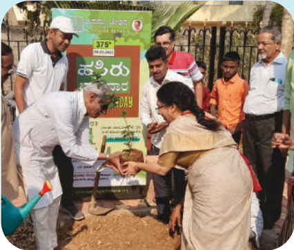
375ನೇ ಹಸಿರು ಭಾನುವಾರ ಕಾರ್ಯಕ್ರಮ ಹುಬ್ಬಳ್ಳಿಯಲ್ಲಿ ನಡೆಯಿತು.