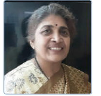
ಛಾಯಾ ಓಕ್ ಬಾಪಟ್

1) ನೀಲಿ ಶಂಖಪುಷ್ಪ ಹೂವುಗಳನ್ನು ನೆರಳಲ್ಲಿ ಒಣಗಿಸಿ, ನೀರಿನಲ್ಲಿ ಚೆನ್ನಾಗಿ ಕುದಿಸಿದ ಒಂದು ಲೋಟ ಬಿಸಿನೀರಿನಲ್ಲಿ ಐದಾರು ಹೂವುಗಳನ್ನು 30 ನಿಮಿಷ ನೆನೆಸಿಡಿ. ನೀರೆಲ್ಲಾ ನೀಲಿ ಬಣ್ಣಕ್ಕೆ ತಿರುಗಿದ ಮೇಲೆ ಮೇಲೆ ಸೋಸಿಕೊಂಡು ಅದಕ್ಕೆ 1/2 ಚಮಚ ನಿಂಬೆರಸ, 1 ಚಮಚ ಜೇನುತುಪ್ಪ ಕಲಸಿ ಕುಡಿಯಿರಿ. ಮೆದುಳಿಗೆ ರಕ್ತ ಸಂಚಾರ ಸುಗಮವಾಗುತ್ತದೆ. ನರಗಳ ಶಕ್ತಿ ಹೆಚ್ಚಿ ಮೆದುಳಿನ ಆರೋಗ್ಯ ಹೆಚ್ಚುತ್ತದೆ, ಜ್ವಾಪಕ ಶಕ್ತಿ ಹೆಚ್ಚುತ್ತದೆ. 2) ಹೂವಿನ ರಸವನ್ನು ಚೆನ್ನಾಗಿ ಶೋಧಿಸಿ ದಿನಕ್ಕೊಮ್ಮೆ ಬಾರಿ ಒಂದೆರಡು ತೊಟ್ಟುಗಳನ್ನು ಕಣ್ಣಿಗೆ ಬಿಡುವುದರಿಂದ ಕಣ್ಣಿನ ಉರಿ ಕಡಿಮೆಯಾಗುತ್ತದೆ. 3) ಹೆಣ್ಣು ಮಕ್ಕಳ ಆರೋಗ್ಯ ಸಮಸ್ಯೆಗಳಲ್ಲಿ ಈ ಹೂವನ್ನು ಔಷಧಿಯಾಗಿ ಬಳಸುತ್ತಾರೆ. 4) ಅರಿತಲೆನೋವು ನಿವಾರಿಸಲು ಶಂಖಪುಷ್ಪದ ಬೇರನ್ನು ತೇದು ಬಳಸುತ್ತಾರೆ. 5) ಎಲೆಗಳ ರಸವನ್ನು ಬಿಸಿ ಮಾಡಿ ಲೇಪಿಸಿದರೆ ಬಾವು ನೋವು ಗುಣವಾಗುತ್ತದೆ. 6) ಬೇರಿನ ರಸವನ್ನು ಹಾಲಿನಲ್ಲಿ ಬೆರೆಸಿ ಶ್ವಾಸನಾಳಗಳ ತೊಂದರೆಗಳ ನಿವಾರಣೆಗೆ ಬಳಸುತ್ತಾರೆ. 7) ಮುಖದಲ್ಲಿ ಬಿಳಿಕಲೆಗಳಿದ್ದರೆ ಬೇರನ್ನು ತೇದು ಲೇಪಿಸಬಹುದು. 8) ಬೇರಿನ ತೊಗಟೆಯಿಂದ ತಯಾರಿಸಿದ ಚೂರ್ಣವನ್ನು ಕಷಾಯದಲ್ಲಿ ಜೇನುತುಪ್ಪ ಬೆರೆಸಿ ಸೇವಿಸಿದರೆ ದೇಹಬಾಧೆ ಗುಣವಾಗುತ್ತದೆ. 9) ಬೀಜವನ್ನು ಹುರಿದು ಪುಡಿ ಮಾಡಿ ಉಷ್ಣದ ಗುಳ್ಳೆಗಳ ಮೇಲೆ ಲೇಪಿಸಿದರೆ ಅವು ವಾಸಿಯಾಗುತ್ತವೆ. 10) ಜೀರ್ಣಾಂಗವ್ಯೂಹದ ಸಮಸ್ಯೆಗಳು ಹೊಟ್ಟೆಯುಬ್ಬರ ಮುಂತಾದ ತೊಂದರೆಗಳನ್ನು ಶಂಖಪುಷ್ಪದ ಬಳಕೆಯಿಂದ ನಿವಾರಿಸಬಹುದೆಂದು ಆಯುರ್ವೇದದಲ್ಲಿ ಹೇಳಲಾಗಿದೆ. 11) ತಲೆ ಕೂದಲು ಕಪ್ಪಾಗಿ ದಟ್ಟವಾಗಿ ಬೆಳೆಯಲು ಕೊಬ್ಬರಿಎಣ್ಣೆಯೊಂದಿಗೆ ನೀಲಿ ಶಂಖಪುಷ್ಪ ಹೂ ಮತ್ತು ಅದರ ಬೇರನ್ನು ಭೃಂಗರಾಜ ಸೊಪ್ಪಿನೊಂದಿಗೆ ಬಳಸುತ್ತಾರೆ. 12) ಮಹಿಳೆಯರಿಗೆ ವಿಶೇಷವಾಗಿ ಉಪಯುಕ್ತವಾಗಿರುವ 'ಸಾರಸ್ವತಾರಿಷ್ಠ' ತಯಾರಿಸಲು ಇದರ ಬೇರನ್ನು ಬಳಸುತ್ತಾರೆ. ●