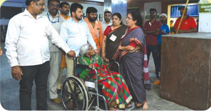
ಅದಮ್ಯ ಚೇತನಕ್ಕೆ ಸಾಲುಮರದ ತಿಮ್ಮಕ್ಕನವರು ಭೇಟಿ ನೀಡಿದ ಸಂದರ್ಭ.