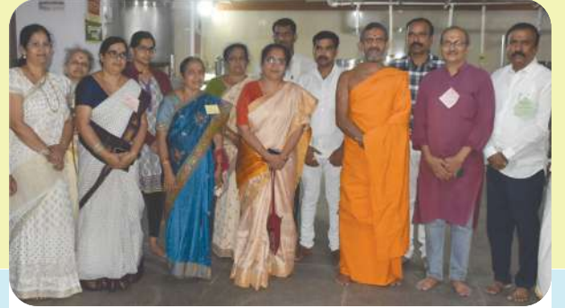
ಅದಮ್ಯ ಚೇತನಕ್ಕೆ ಆಗಮಿಸಿದ್ದ ಪೇಜಾವರ ಶ್ರೀಗಳು ಅನ್ನಪೂರ್ಣ ಅಡುಗೆಮನೆಯನ್ನು ವೀಕ್ಷಿಸಿದರು.