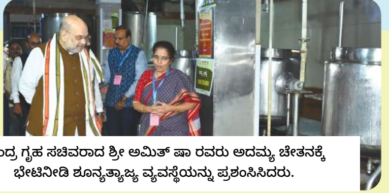
ಕೇಂದ್ರ ಗೃಹ ಸಚಿವರಾದ ಶ್ರೀ ಅಮಿತ್ ಷಾ ರವರು ಅದಮ್ಯ ಚೇತನಕ್ಕೆ ಭೇಟಿನೀಡಿ ಶೂನ್ಯತ್ಯಾಜ್ಯ ವ್ಯವಸ್ಥೆಯನ್ನು ಪ್ರಶಂಸಿಸಿದರು.