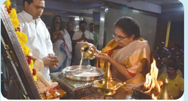
ಅದಮ್ಯ ಚೇತನಕ್ಕೆ ಆಗಮಿಸಿದ ಅಕ್ಕಲಕೋಟಿ ಸಮರ್ಥ ಮಹಾರಾಜರ ಪಾದುಕೆಗಳನ್ನು ಪೂಜಿಸಲಾಯಿತು.