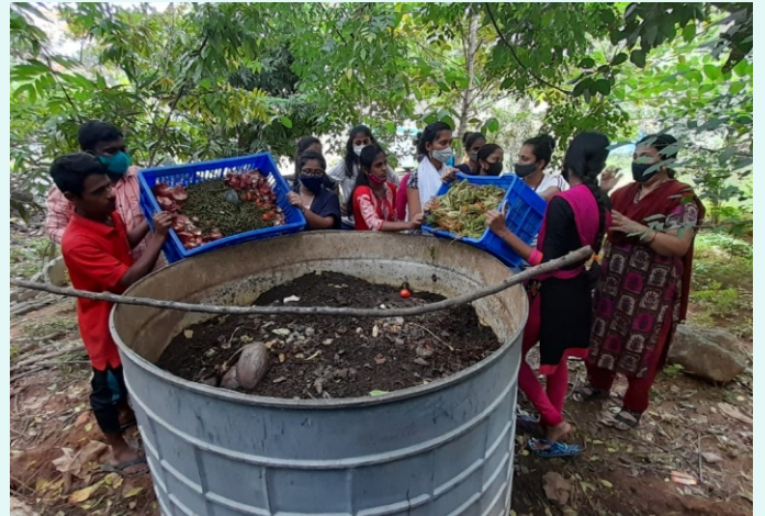
ಅದಮ್ಯಚೇತನದಲ್ಲಿ ಇಂಟರ್ನ್ ಶಿಪ್ ತರಬೇತಿ ಪಡೆಯುತ್ತಿರುವ ಕಾಲೇಜು ವಿದ್ಯಾರ್ಥಿನಿಯರು ಸಂಸ್ಥೆಯ ವಿವಿಧ ಚಟುವಟಿಕೆಗಳಲ್ಲಿ ಸಕ್ರಿಯವಾಗಿ ಪಾಲ್ಗೊಂಡರು.