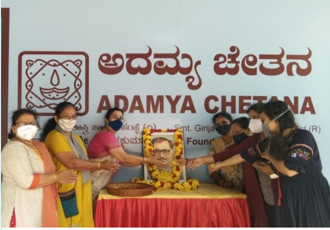
ಅದಮ್ಯ ಚೇತನದಲ್ಲಿ ದೀನ ದಯಾಳ್ ಉಪಾಧ್ಯಾಯ ಅವರ ಜಯಂತಿಯನ್ನು ಆಚರಿಸಲಾಯಿತು.

( ಅದಮ್ಯ ಚೇತನ - ತಿಂಗಳ ಚಟುವಟಿಕೆಗಳ ಚಿತ್ರಸಂಪುಟ )