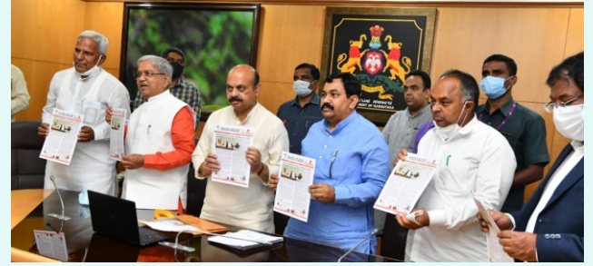
ಪುಟ 4 ರಲ್ಲಿ ಮುಂದುವರಿದಿದೆ

ಅನಂತಪಥ ಮಾಸಪತ್ರಿಕೆಯ 15ನೆಯ ಸಂಚಿಕೆಯನ್ನು ಕಳೆದ ಸೆಪ್ಟೆಂಬರ್ 22ರಂದು ಕರ್ನಾಟಕದ ಮುಖ್ಯಮಂತ್ರಿ ಶ್ರೀ ಬಸವರಾಜ ಬೊಮ್ಮಾಯಿಯವರು ಬಿಡುಗಡೆ ಮಾಡಿದರು.