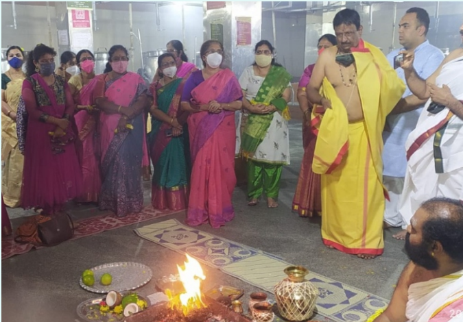
ನವರಾತ್ರಿಯ ಶುಭಸಂದರ್ಭದಲ್ಲಿ ಅದಮ್ಯಚೇತನ ಸಂಸ್ಥೆಯಲ್ಲಿ ಪೂಜಾ ಹವನಾದಿಗಳನ್ನು ಭಕ್ತಿಶ್ರದ್ಧೆಗಳಿಂದ ಆಚರಿಸಲಾಯಿತು.