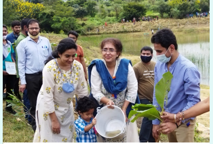
೩೦೦ನೇ ಪಸಿರು ಭಾನುವಾರ ಕಾರ್ಯಕ್ರಮವನ್ನು ಭವಾನಿ ಮಾನ್ ಕೆರೆ ಅಂಗಳದಲ್ಲಿ ನಡೆಸಲಾಯಿತು.