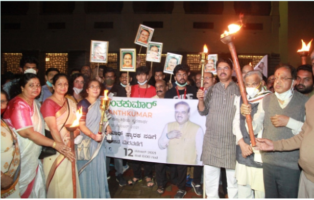
ಅನಂತಕುಮಾರ್ ಸ್ಮಾರಕ ನಡಿಗಿ-ಪಂಜಿನಿ ಮೆರವಣಿಗೆ