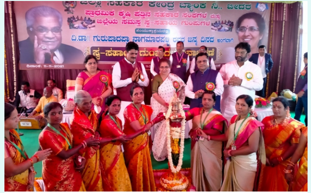
ಬೀದರ್ ಮಹಿಳಾ ಸ್ವಸಹಾಯ ಗುಂಪುಗಳ ವಾರ್ಷಿಕೋತ್ಸವದಲ್ಲಿ