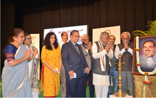
ಅನಂತನಮನ ಕಾರ್ಯಕ್ರಮದಲ್ಲಿ ಗಣ್ಯರಿಂದ ಗೌರವಾರ್ಪಣೆ

( ಅದಮ್ಯ ಚೇತನ - ತಿಂಗಳ ಚಟುವಟಿಕೆಗಳ ಚಿತ್ರಸಂಪುಟ )