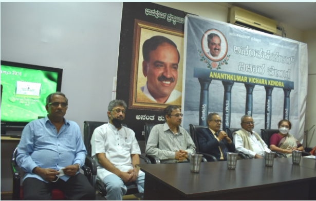
ಯುವಪೀಳಿಗೆಗೆ ಪರಂಪರೆ ಪರಿಚಯ ಕಾರ್ಯಕ್ರಮದ ಉದ್ಘಾಟನಾ ಕಾರ್ಯಕ್ರಮ