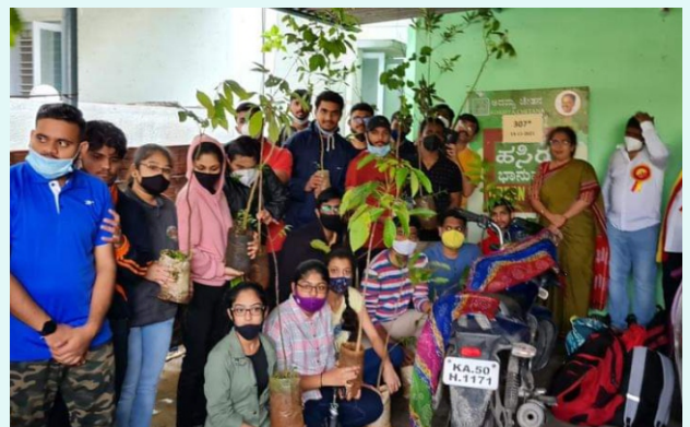
ಹಸಿರು ಭಾನುವಾರ ಕಾರ್ಯಕ್ರಮ