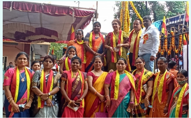
ಇಟ್ಟಮಡುವಿನಲ್ಲಿ ಜರುಗಿದ ರಾಜ್ಯೋತ್ಸವ ಕಾರ್ಯಕ್ರಮ