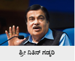
ಶ್ರೀ ನಿತಿನ್ ಗಡ್ಡಿ

ಸುಸ್ಥಿರವಾದ ಜೀವನ ದೊರೆಯಬೇಕು ಎಂಬುದು ನಮ್ಮ ಆಶಯ. ಜೊತೆಗೆ ಈ ನಮ್ಮ ಮಾತೃಭೂಮಿಯು ಸುಖೀ ಮತ್ತು ಸಂಪನ್ನ ದೇಶವಾಗಿದ್ದರೆ ಸಾಲದು, ಇಡೀ ಪ್ರಪಂಚದಲ್ಲಿ ಅತ್ಯಂತ ಶಕ್ತಿಶಾಲಿ ರಾಷ್ಟ್ರವಾಗಿ ಬೆಳೆಯಬೇಕು. ಇತರರ ಮೇಲೆ ಆಕ್ರಮಣ ಮಾಡಿ ದೇಶದ ಗಡಿಗಳನ್ನು ವಿಸ್ತರಿಸುವುದು ನಮ್ಮ ಉದ್ದೇಶವಲ್ಲ; ಆದರೆ ಶಾಂತಿ ಮತ್ತು ಅಹಿಂಸೆಗಳ ಪಾಲನೆಗೂ