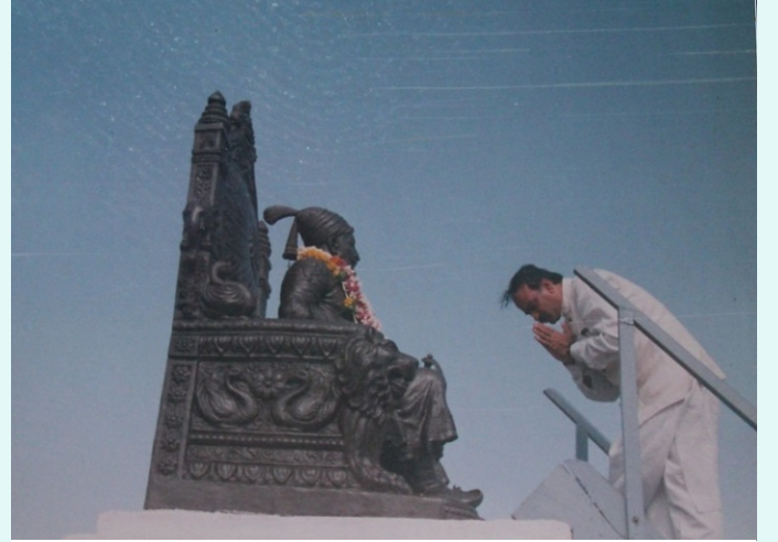
ರಾಯಗಡದಲ್ಲಿ ಶಿವಾಜಿ ಮಹಾರಾಜರ ಕೋಟೆಯ ಅಭಿವೃದ್ಧಿಗೆ ಕೇಂದ್ರದ ನೆರವು ಘೋಷಿಸಿದ ಸಂದರ್ಭದ ಚಿತ್ರ (2000).