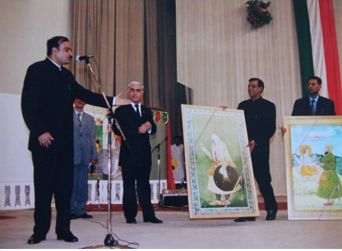
ಸಂಸ್ಕೃತಿ ಖಾತೆಯ ಸಚಿವರಾಗಿದ್ದಾಗ ಅನಂತಕುಮಾರ್ ಮಧ್ಯಕಾಲೀನ ಕಲಾಚಿತ್ರಗಳ ಪ್ರದರ್ಶನಿಯಲ್ಲಿ ಭಾಗವಹಿಸಿದ್ದ ಚಿತ್ರ (1999).