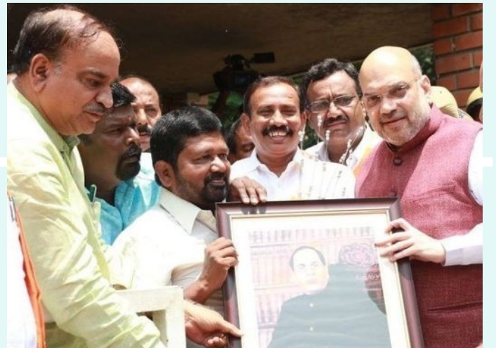
ಖ್ಯಾತ ಕವಿ ಸಿದ್ದಲಿಂಗಯ್ಯರವರೊಡನೆ ಸಮಾರಂಭವೊಂದರಲ್ಲಿ (2017).