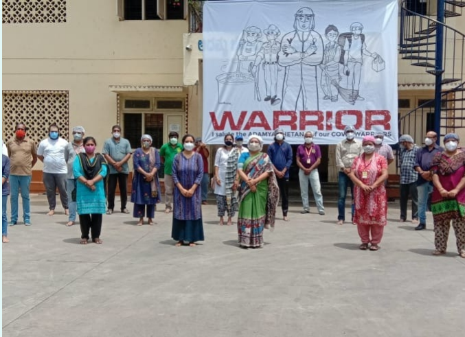
ಕೋವಿಡ್ ಎರಡನೇ ಅಲೆಯ ವಿರುದ್ಧದ ಸಮರಕ್ಕೆ ಕಾರ್ಯಸನ್ನದ್ಧರಾದ ಅದಮ್ಯ ಚೇತನ ಕಾರ್ಯಕರ್ತರು