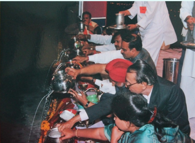
ಬ್ರಹ್ಮಪುತ್ರ ದರ್ಶನ (2001).