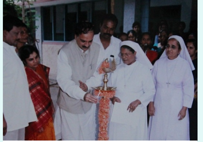
ಸಂಸದ್ ಸದಸ್ಯರಾಗಿದ್ದ ಅನಂತಕುಮಾರ್ ಬಿನ್ನಿಪೇಟೆಯ ಚರ್ಚ್ ನ ಕಾರ್ಯಕ್ರಮವೊಂದರಲ್ಲಿ ಭಾಗವಹಿಸಿದ್ದರು (2002).