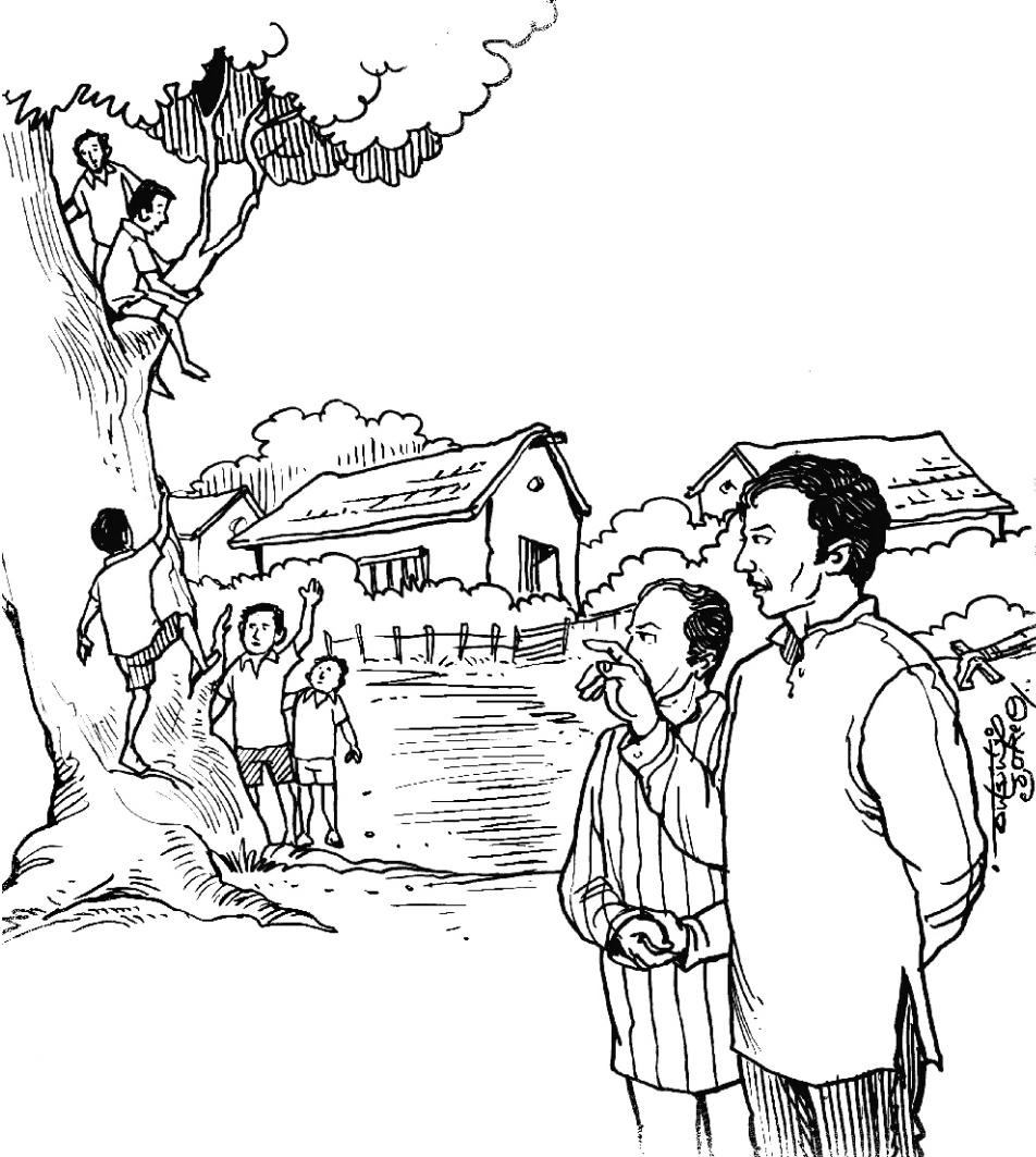
ಪುಟ 10ರಲ್ಲಿ ಮುಂದುವರಿದಿದೆ