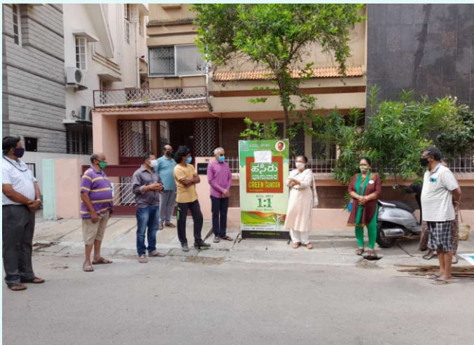
ಹಸಿರು ಭಾವನಾರದ 285 ನೇ ಕಾರ್ಯಕ್ರಮ