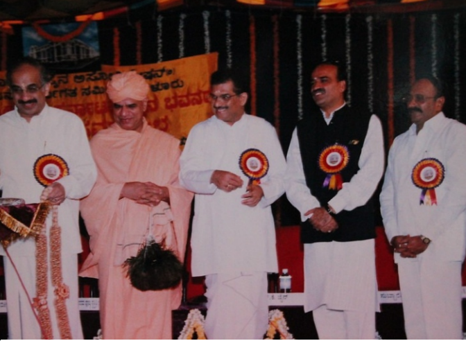
ಕರ್ನಾಟಕ ಜೈನ್ ಭವನದ ಕಟ್ಟಡದ ಭೂಮಿಪೂಜಾ ಕಾರ್ಯಕ್ರಮದಲ್ಲಿ ಪಾಲ್ಗೊಂಡಿದ್ದ ಸಂದರ್ಭದ ಚಿತ್ರ (2000).