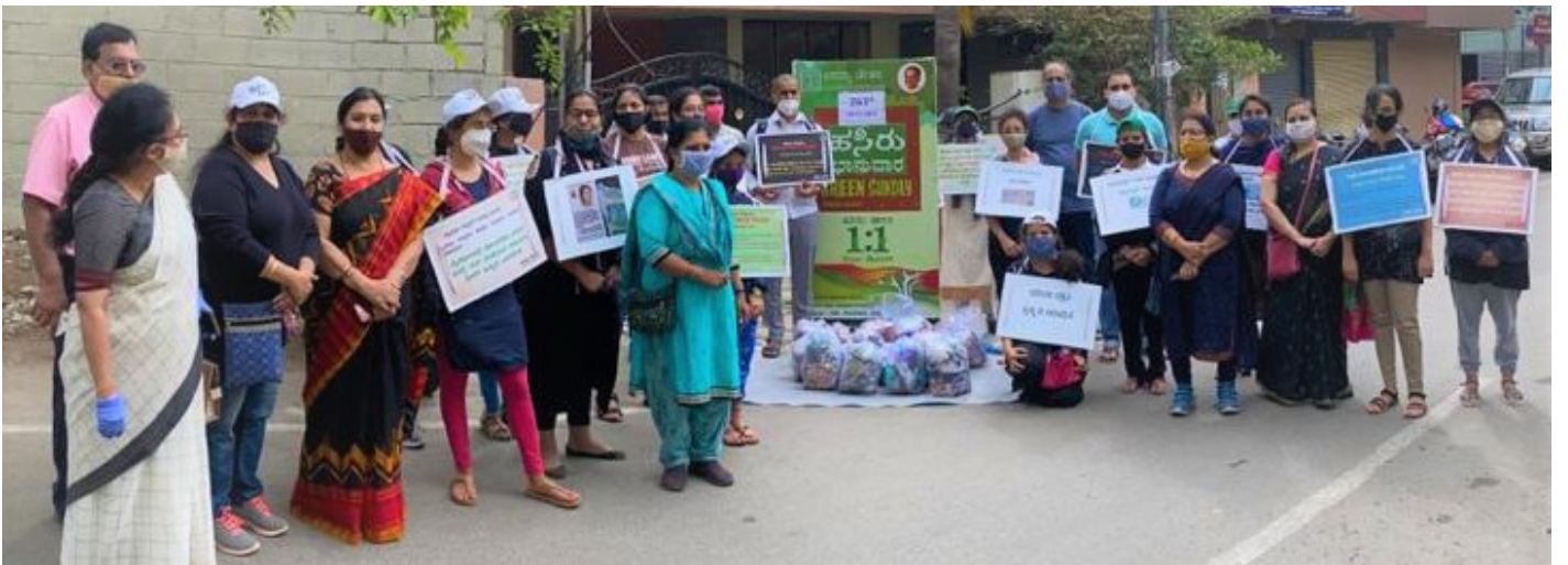
ಅದಮ್ಯ ಚೇತನದ ಅಂಗಸಂಸ್ಥೆಯಾದ ಯುವ ಚೇತನದ ಸದಸ್ಯರು ಬೆಂಗಳೂರಿನ ರಸ್ತೆಗಳಲ್ಲಿ ಪ್ಲಾಸ್ಟಿಕ್ ತ್ಯಾಜ್ಯ ಮೊದಲಾದವನ್ನು ತೆಗೆದು ಜನರಲ್ಲಿ ಪರಿಸರ ಜಾಗೃತಿ ಮೂಡಿಸುತ್ತಿದ್ದಾರೆ.