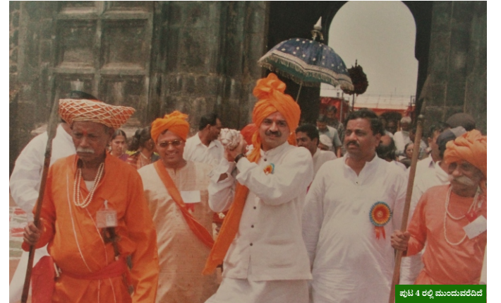
ಪುಟ 4 ರಲ್ಲಿ ಮುಂದುವರಿದಿದೆ

ಭೌಗೋಳಿಕವಾಗಿ ಅತ್ಯಂತ ಸುಂದರ ಹಾಗೂ ಸಾಂಸ್ಕೃತಿಕವಾಗಿ ಅತ್ಯಂತ ಶ್ರೀಮಂತವಾಗಿರುವ ಲಡಾಖ್ ಪ್ರದೇಶವನ್ನು ಉತ್ಸವಕ್ಕಾಗಿ ಆರಿಸಿದ್ದು ಯುಕ್ತವಾಗಿತ್ತು. ಲೇಹ್ ಪಟ್ಟಣದಲ್ಲಿ ನಡೆಯುತ್ತಿರುವ ಈ ಉತ್ಸವವು ಇಡೀ ಪ್ರದೇಶದ ಪ್ರವಾಸಿ ತಾಣಗಳ ಅಭಿವೃದ್ಧಿ ಮತ್ತು ಹಿಂದೂ ಸಂಸ್ಕೃತಿಗೆ ಉತ್ತೇಜನ ನೀಡುವ ನಿಟ್ಟಿನಲ್ಲಿ ಯಶಸ್ವಿಯಾಗಿದೆ. ಲೇಹ್ ಪಟ್ಟಣದಿಂದ 15 ಕಿಲೋಮೀಟರ್ ದೂರದಲ್ಲಿರುವ ಶೇ ಎಂಬ ಪ್ರದೇಶದಲ್ಲಿ ಸಿಂಧೂ ಸಂಸ್ಕೃತಿಕ ಕೇಂದ್ರದ ಕಟ್ಟಡಕ್ಕೆ