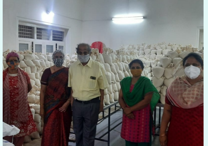
ಬಟ್ಟೆಯ ಜೀಲಗಳಲ್ಲಿ ಧಾನ್ಯಗಳನ್ನು ತುಂಬಿ ವಿತರಿಸುವ ಪ್ರಕ್ರಿಯೆಗೆ ಚಾಲನೆ