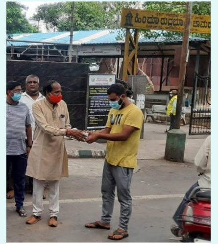
ಕೋವಿಡ್ ಸಂದರ್ಭದಲ್ಲಿ ವಿವಿಧ ರುದ್ರಭೂಮಿಗಳಲ್ಲಿ ಅನ್ನದಾನ