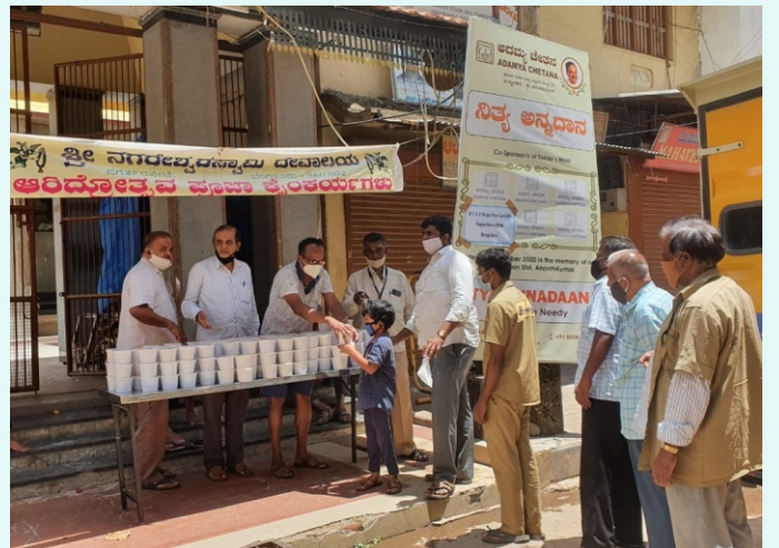
ನಗರ್‌ಪೇಟೆಯಲ್ಲಿ ನಿತ್ಯ ಅನ್ನದಾನದ ಪ್ರಾರಂಭ